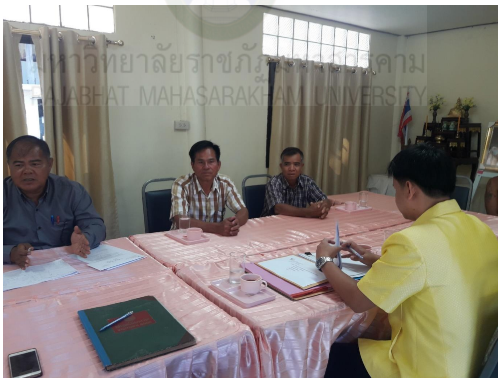
ภาพที่ จ.2 สัมภาษณ์ ครู โรงเรียนชัยมงคลวิทยา วันที่ 27 สิงหาคม 2561