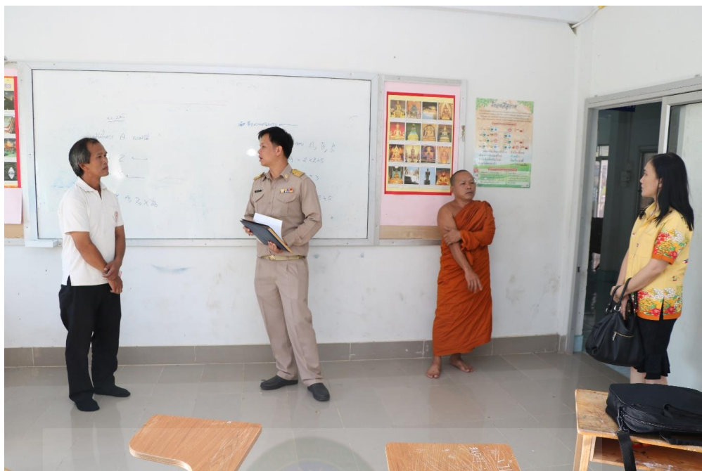
ภาพที่ จ.17 สอบถามความคิดเห็นของผู้จัดการ และคณะครู โรงเรียนพระปริยัติธรรมวัดปฐมแพ่งศรี วันที่ 27 สิงหาคม 2561