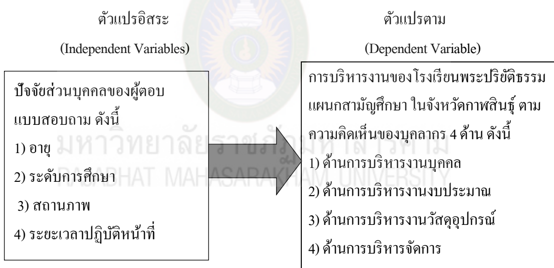
ภาพที่ 2.1 กรอบแนวคิดการวิจัย

การวิจัยการบริหารงานของโรงเรียนพระปริยัติธรรม แผนกสามัญศึกษา ในจังหวัดกาฬสินธุ์ ตามความคิดเห็นของบุคลากร ผู้วิจัยใช้กรอบแนวคิด 4M's (Man, Money, Material, Management) (วิรัช วิรัชนิภาวรรณ, 2549, น. 22-23, บุญทัน ดอกไธสง, 2551, น. 1) ดังภาพที่ 2.1