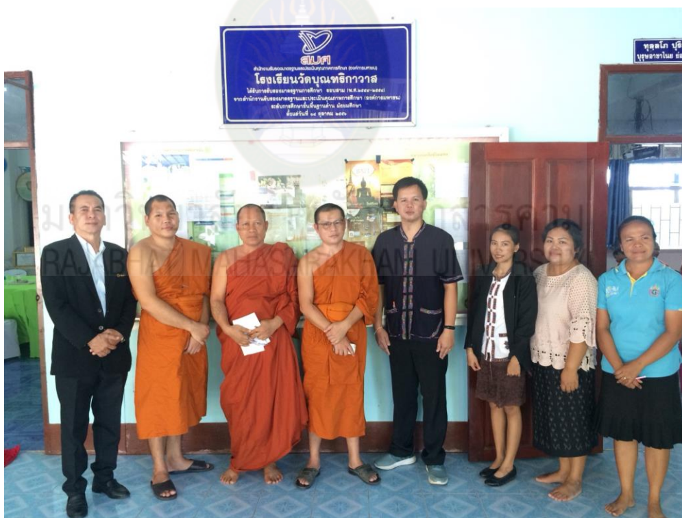
ภาพที่ จ.4 บันทึกภาพหลังจากสัมภาษณ์และทำแบบสอบถามเสร็จ กับคณะผู้อำนวยการและคณะครู เจ้าหน้าที่ โรงเรียนวัดบุญชริกาวาส วันที่ 3 กันยายน 2561