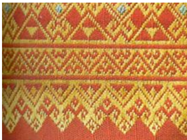
ภาพที่ 2.9 ลายพินปลา : ผ้าตีนจก ลายพินปลา (สารานุกรมสำหรับเยาวชน, 2561)