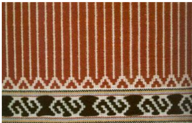
ภาพที่ 2.6 ลายเส้นตรง ลายซิกแซก ลายตะขอ (สารานุกรมสำหรับเยาวชน, 2561)