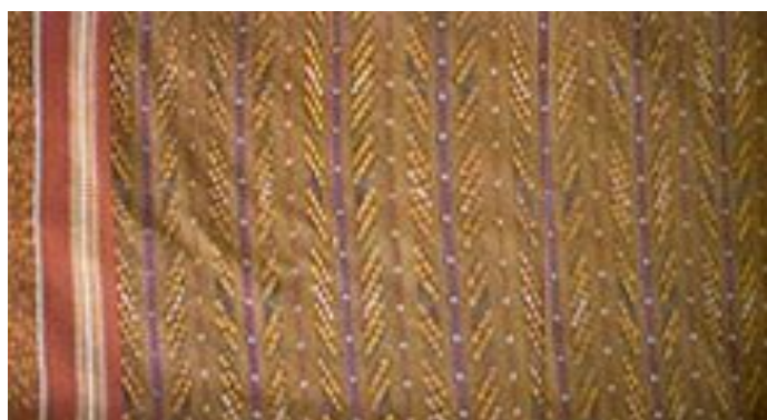
ภาพที่ 2.8 ลายต้นไม้ : ผ้าไหมโฮลลายต้นไม้ (สารานุกรมสำหรับเยาวชน, 2561)