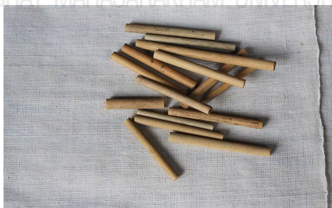
ภาพที่ 2.25 แสดงภาพของหลอดไม้ (การศึกษาศิลปกรรมท้องถิ่น, 2556, เว็บไซต์)

3.6 หลอดไม้ ใช้สำหรับพันฝ้ายเส้นพุ่ง ในขณะที่ใช้งานจะนำไปเสียบกับกระจวย หลอดไม้ทำจากปล้องไม้ไผ่บง ซึ่งมีความหนาและทนกว่าไม้ไผ่ทั่วไป มีรูทะลุตลอดปล้องสำหรับเสียบเหล็กเพื่อยึดกับกระจวย แสดงดังภาพที่ 2.25