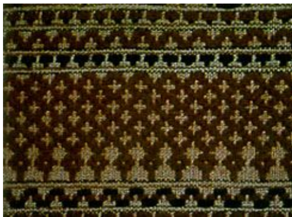
ภาพที่ 2.11 ผ้าขิดลายกากบาท (สารานุกรมสำหรับเยาวชน, 2561)