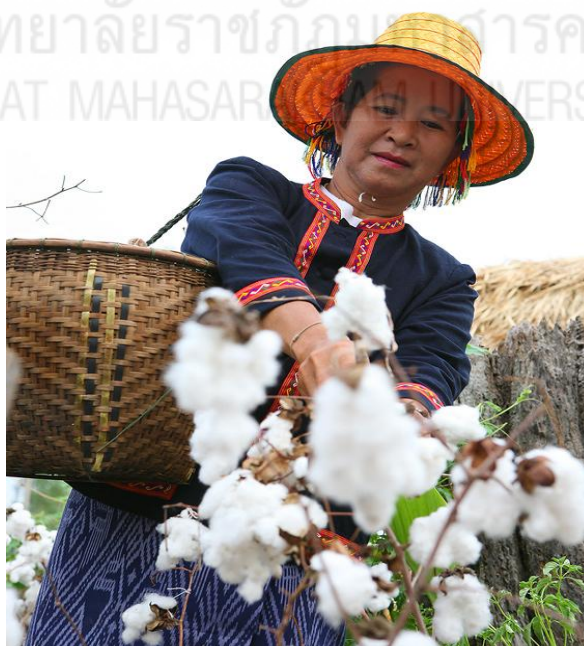
ภาพที่ 2.19 ฝ้ายที่ปลูกขึ้นเอง (พิพิธภัณฑสถานผ้าทองคำ, 2555, เว็บไซต์)

3.1 ฝ้าย อาจปลูกขึ้นเอง หรือจะซื้อสำเร็จรูป ซึ่งมีทั้งฝ้ายที่ย้อมสีสำเร็จและฝ้ายที่ต้องนำมา ย้อมสีเอง แสดงได้ดังภาพที่ 2.19 – 2.20