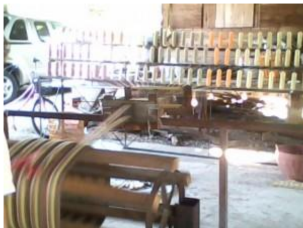
ภาพที่ 2.31 การนำเส้นด้ายมากรอใส่หลอด (Nammorn Design, 2561)