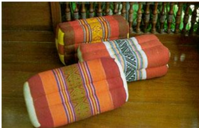
ภาพที่ 2.16 หมอนขิดลายพระอาทิตย์ ลายปราสาท ลายตากบ (สารานุกรมสำหรับเยาวชน, 2561)