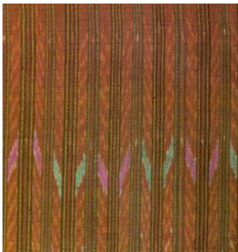
ภาพที่ 2.18 ผ้ามัดหมี่สุรินทร์ (สารานุกรมสำหรับเยาวชน, 2561)

ผ้าพื้นบ้านพื้นเมืองของไทยที่ทอกันตามท้องถิ่นต่าง ๆ ในปัจจุบันนี้เต็มไปด้วยลวดลาย และสัญลักษณ์ต่าง ๆ มากมาย ซึ่งผู้ใช้ผ้าในยุคปัจจุบันอาจไม่เข้าใจความหมาย และมองไม่เห็นคุณค่า ลวดลายและสัญลักษณ์เหล่านี้ บางลายก็มีชื่อเรียกสืบต่อกันมาหลายชั่วคน บางชื่อก็เป็นภาษาท้องถิ่น ไม่เป็นที่เข้าใจของคนไทยในภาคอื่น ๆ เช่น ลายเอี้ย ลายบักจัน ฯลฯ บางชื่อก็เรียกกันมาโดยไม่รู้ประวัติ เช่น ลายแมงมุม ลายปลาหมึก ซึ่งแม้แต่ผู้ทอก็อธิบายไม่ได้ว่าทำไมจึงเรียกชื่อนั้น บางลวดลายก็มีผู้ตั้งชื่อ ให้ใหม่ เช่น ลาย "ขอพระเทพ" เป็นต้น สัญลักษณ์ และลวดลายบางอย่าง ก็เชื่อมโยงกับคติและความเชื่อ ของคนไทยพื้นบ้าน ที่นับถือสืบต่อกันมาหลาย ๆ ชั่วอายุคน และยังสามารถเชื่อมโยง กับลวดลาย ที่ปรากฏอยู่ในศิลปะอื่นๆ เช่น บนจิตรกรรมฝาผนัง และสถาปัตยกรรม หรือบางที ก็มีกล่าวถึงในตำนาน พื้นบ้าน และในวรรณคดี เป็นต้น