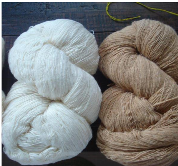
ภาพที่ 2.20 ฝ้ายที่ซื้อสำเร็จรูป

3.2 กี่ทอผ้า ปัจจุบันมี 2 ขนาด คือ กี่ขนาดใหญ่ใช้ทอผ้าที่มีความกว้างมาก เวลาทอต้องใช้คน 2 คน ช่วยกันพุ่งกระสวยไปมา ส่วนกี่ขนาดที่สองเป็นกี่ขนาดเล็กซึ่งใช้แรงงานของคนทอเพียงคนเดียว แสดงได้ดังภาพที่ 2.21