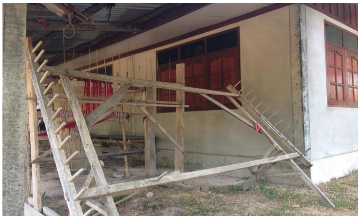
ภาพที่ 2.28 แสดงภาพของบันไดลิง (กงใจ โมศิริ, 2562, เว็บไซต์)

3.9 บันไดลิง บันไดลิงในอดีตมีลักษณะเป็นเกววัลย์ ที่มีลักษณะโค้งงอเหมือนบันได ปัจจุบันบันไดลิงหายาก จึงเปลี่ยนมาใช้ไม้ตอกตะปูห่างกันประมาณ 3 นิ้ว โดยตัดตะปูให้โค้งงอสำหรับเกี่ยวเส้นฝ้ายไว้และยังคงใช้ชื่อเรียกดังเช่นอดีต แสดงได้ดังภาพที่ 2.28