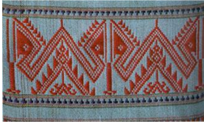
ภาพที่ 2.14 ลายนาคและปราสาท (สารานุกรมสำหรับเยาวชน, 2561)