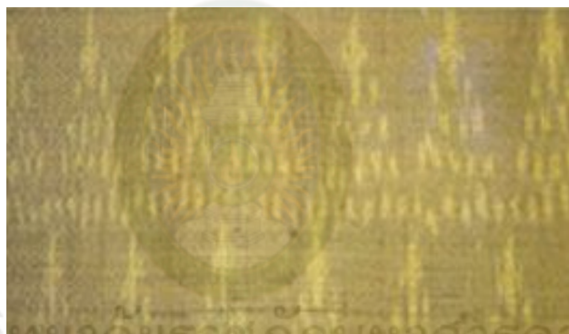
ภาพที่ 2.7 ลายฝนตก : ลวดลายผ้ามัดหมี่พื้นบ้านที่มีลักษณะเหมือนฝนตกหรือกองฟาง (สารานุกรมสำหรับเยาวชน, 2561)