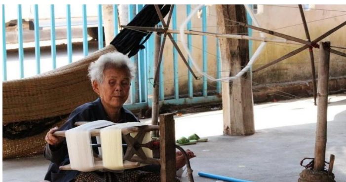
ภาพที่ 2.29 แสดงการนำฝ้ายมาเข็นหรือปั่นใส่กระบอกร (ทอง ทองศร. 2559, เว็บไซต์)

4.1.1 นำฝ้ายเป็นใจมาคลี่ออกใส่กงกัวกั้ว เพื่อนำไปพันใส่บาหลูกกัวกั้วฝ้าย แล้วนำมาเข็นหรือปั่นใส่กระบอกรหรือหลอดไม้ขนาดใหญ่ การปั่นฝ้ายใส่กระบอกร ถ้าต้องการเส้นด้ายที่มีเส้นใหญ่ อาจจะปั่นครั้งละ 2-3 ใจ ให้เส้นฝ้ายมารวมกัน ดังภาพที่ 2.29