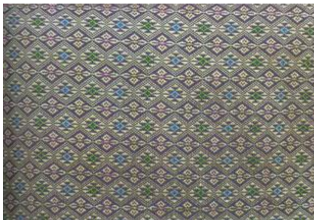
ภาพที่ 2.2 ตัวอย่างผ้าที่ทอเป็นลวดลายด้วยเทคนิคชิต (สารานุกรมสำหรับเยาวชน, 2561)

ผ้ามัดหมี่สมัยใหม่ที่อำเภอบ้านหมี่ จังหวัดลพบุรี ซึ่งนำลวดลายจากถิ่นอื่นมาประยุกต์ในการทอและใช้ใยสังเคราะห์แทนฝ้าย สีที่ใช้เป็นสีเคมีดูรายละเอียดเพิ่มเติม ภาพที่ 2.3