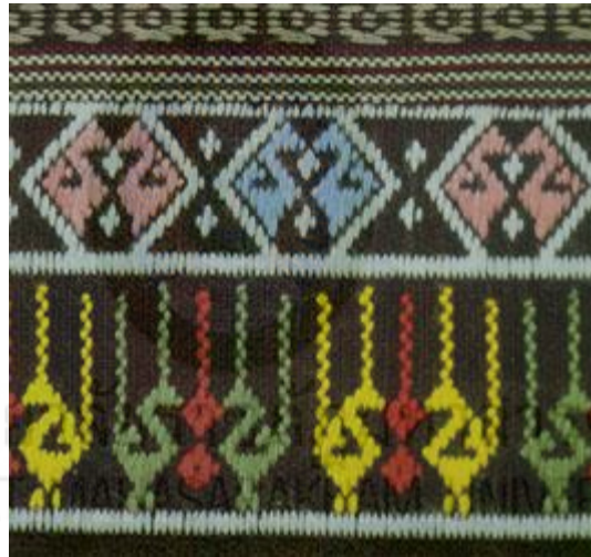
ภาพที่ 2.15 ผ้าตีนจก ลายกากบาท (พระอาทิตย์) พระจันทร์ และนก (สารานุกรมสำหรับเยาวชน, 2561)