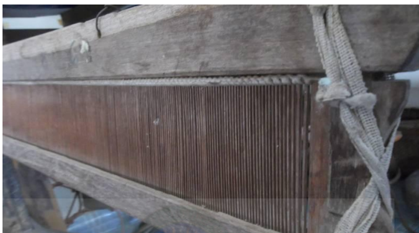
ภาพที่ 2.22 แสดงภาพฟืม

3.3 ฟืม ทำจากต้นไม้ยาวพอสมควรตามขนาดของกี่ มีด้ามสำหรับจับเพื่อใช้ดึงให้ฟืมดันฝ้ายเส้นพุ่งให้ติดกันแน่นเป็นผืน แสดงได้ดังภาพที่ 2.22