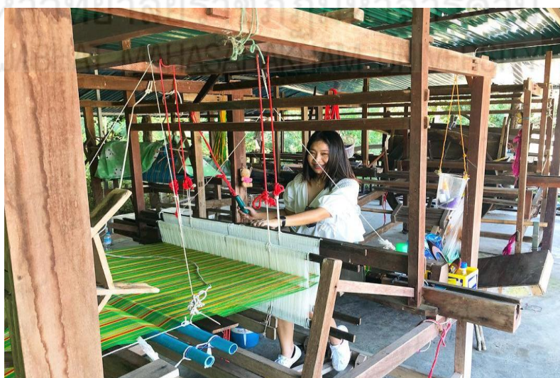
ภาพที่ 2.21 แสดงภาพกี่ทอผ้า (ดวง ทองคำช้อย, 2557, เว็บไซต์)

3.2 กี่ทอผ้า ปัจจุบันมี 2 ขนาด คือ กี่ขนาดใหญ่ใช้ทอผ้าที่มีความกว้างมาก เวลาทอต้องใช้คน 2 คน ช่วยกันพุ่งกระสวยไปมา ส่วนกี่ขนาดที่สองเป็นกี่ขนาดเล็กซึ่งใช้แรงงานของคนทอเพียงคนเดียว แสดงได้ดังภาพที่ 2.21