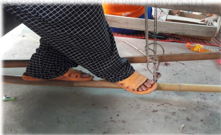
ภาพที่ 2.23 แสดงภาพของไม้เหยียบ (สุพัตรา ยะปะตัง, 2560, เว็บไซต์)

3.4 ไม้เหยียบ ทำจากไม้ไผ่หรือไม้สัก ขนาดกว้างประมาณ 2-3 นิ้ว ความยาวประมาณ 2-3 ฟุต สำหรับให้ผู้ทอเหยียบในขณะที่ทอเพื่อสลับเส้นฝ้าย ไม้เหยียบนี้จะอยู่ด้านล่างของกี่ เมื่อเหยียบไม้แล้วจะช่วยยกเส้นฝ้ายขึ้นลงเป็นลายขัดกัน จำนวนของไม้เหยียบจะขึ้นอยู่กับจำนวนเขาฟืมที่กำหนดลวดลายที่จะทอ แสดงได้ดังภาพที่ 2.23