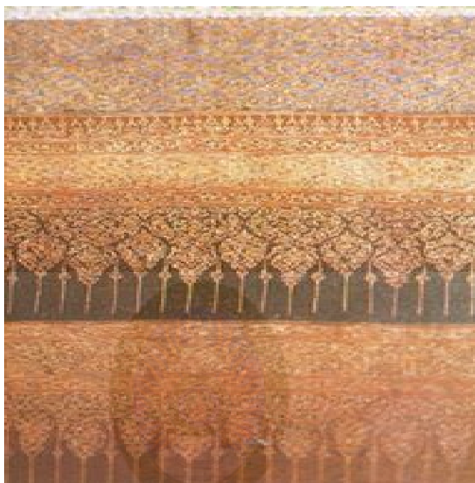
ภาพที่ 2.4 การทอผ้าแบบพื้นบ้านพื้นเมือง ในภูมิภาคต่าง ๆ (สารานุกรมสำหรับเยาวชน, 2561)

ผ้าพิมพ์ที่เป็นลวดลายบนผ้าฝ้ายเนื้อดี ซึ่งใช้เป็นผ้านุ่งของขุนนางในสมัยโบราณจากคลังสะสม ผ้าลายอย่างโบราณของนายเผ่าทอง ทองเจือ ดูรายละเอียดเพิ่มเติม ภาพที่ 2.4