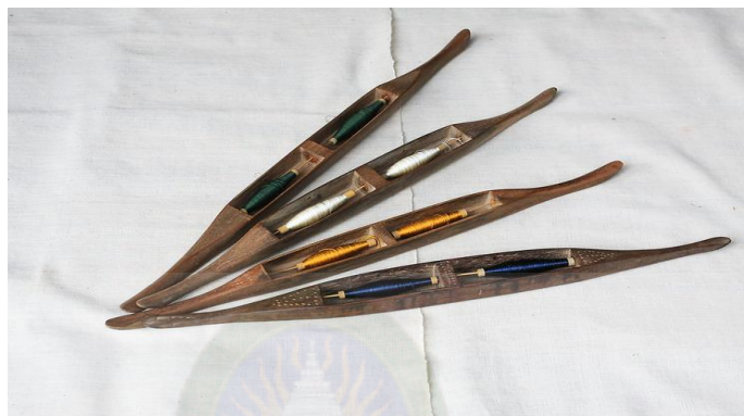
ภาพที่ 2.24 แสดงภาพของกระจวย (จุมพล จันทราพร, 2560, เว็บไซต์)

3.5 กระจวย กระจวยเป็นอุปกรณ์ลักษณะยาวรี เจาะเป็นช่องตรงกลางเพื่อใส่หลอดไม้พันฝ้ายเจาะรูด้านข้าง ขนาดให้เส้นฝ้ายลอดผ่านได้ ปลายของกระจวยทั้งสองข้างอาจมนหรือแหลมตามลักษณะการใช้งาน ถ้าหัวมน เอาไว้ใช้สำหรับกักระตุก ส่วนหัวแหลมไว้สำหรับพุ่งด้วยมือ ในขณะที่ทอผู้ทอจะพุ่งกระจวยไปมา เพื่อให้เส้นฝ้ายที่พุ่งไป มา ไปขัดกับฝ้ายที่เป็นเส้นยืน แสดงดังได้ภาพที่ 2.24