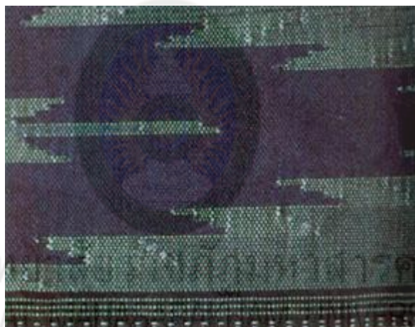
ภาพที่ 2.17 ผ้าลายน้ำไหล (สารานุกรมสำหรับเยาวชน, 2561)