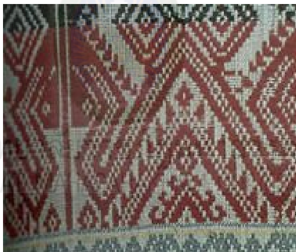
ภาพที่ 2.10 ลายพญานาคหรืองู และปราสาท : ผ้าขิดลายนาคและปราสาท (สารานุกรมสำหรับเยาวชน, 2561)