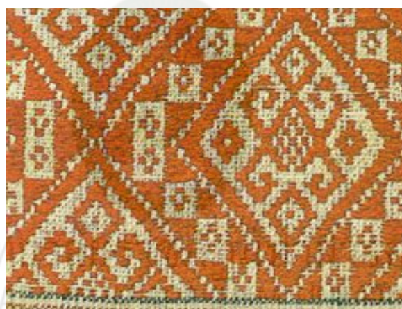
ภาพที่ 2.12 ผ้าขิดลายขนมเปียกปูน (สารานุกรมสำหรับเยาวชน. 2561)