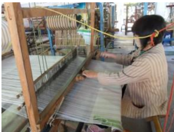
ภาพที่ 2.30 การทอผ้าตามลายที่ต้องการ (Nammorn Design, 2561)

4.1.6 หลังจากการสับลายแล้ว สามารถเริ่มกระบวนการทอได้ โดยการเหยียบไม้เหยียบเพื่อยกเขาฟิมขึ้นลง แล้วพุ่งกระสวยสอดเข้าไปในช่องว่างระหว่างเส้นยืน ให้เส้นพุ่งพุ่งไปซัดกับเส้นยืน และใช้ฟิมดันให้เส้นพุ่งอัดเรียงกันแน่น แล้วใช้เท้าเหยียบไม้เหยียบให้ตะกอลิ้นสลับขึ้นลง และพุ่งกระสวยกลับไปกลับมาซัดกับเส้นยืน หลังจากที่พุ่งเส้นพุ่ง ไป มา และใช้ฟิมดันให้เส้นพุ่งแน่นหลาย ๆ ครั้ง ก็จะได้ผ้าทอเป็นผืน แล้วนำไปแปรรูปเป็นผลิตภัณฑ์ต่างๆ ต่อไป