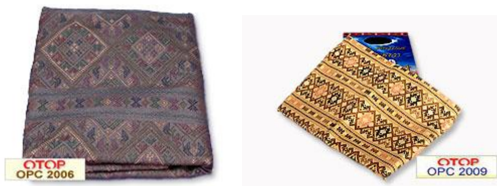
ภาพที่ 2.1 ตัวอย่างลายผ้าทอมือ (ไทยตำบลดอทคอม, 2561)

จากหลักฐานทางโบราณคดีแสดงว่า ดินแดนที่เป็นประเทศไทยในปัจจุบันนี้เคยมีการใช้ผ้า และทอผ้าได้ตั้งแต่สมัยก่อนประวัติศาสตร์ เมื่อราว 2000-4000 ปีมาแล้ว โดยได้พบเศษผ้าติดอยู่กับคราบ สนิมของกำไลทองสำริด ละแวกดินเผาซึ่งเป็นอุปกรณ์ปั้นด้วยแบบง่าย ๆ รวมทั้งลูกกลิ้งแกะลายสำหรับ ใช้ทำลวดลายบนผ้าเป็นจำนวนมาก อยู่ที่บริเวณแหล่งวัฒนธรรมบ้านเชียง อำเภอหนองหาน จังหวัดอุดรธานี นับเป็นหลักฐานเก่าแก่ที่สุดเกี่ยวกับการใช้ผ้า และการทอผ้าของไทยในอดีตต่อมาในสมัย ทวารวดี ศรีวิชัย สุโขทัย อยุธยา และรัตนโกสินทร์ ก็มีหลักฐานทางประวัติศาสตร์ซึ่งพบในศิลาจารึก พงศาวดาร จดหมายเหตุและบันทึกของชาวต่างประเทศเกี่ยวกับเรื่องราวทางประวัติศาสตร์แสดงว่า มีการใช้ประโยชน์จากผ้าอย่างต่อเนื่อง ทั้งที่เป็นเครื่องนุ่งห่มและเครื่องใช้ต่างๆ โดยมีทั้งผ้าที่ผลิตขึ้นเอง ในท้องถิ่น และผ้าที่นำเข้ามาจากต่างประเทศในที่นี่จะกล่าวถึงผ้าตั้งแต่สมัยสุโขทัยเรื่อยมาจนถึงสมัย รัตนโกสินทร์ ซึ่งมีหลักฐานที่ระบุไว้ค่อนข้างชัดเจนโดยแยกออกเป็นยุคสมัย (สื่อการเรียนการสอนออนไลน์ , 2559, เว็บไซต์)