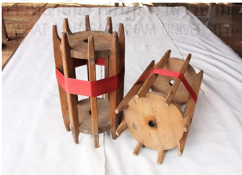
ภาพที่ 2.27 แสดงภาพของกระบอก

3.8 กระบอก โครงไม้เป็นอุปกรณ์สำหรับใช้พันฝ้าย แสดงได้ดังภาพที่ 2.27