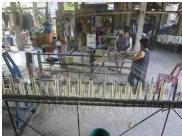
ภาพที่ 2.32 นำเส้นด้ายที่กรอแล้วไว้ใส่หลอด (Nammorn Design, 2561)