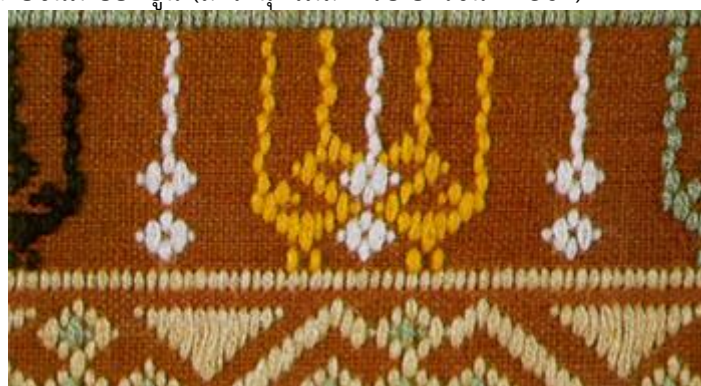
ภาพที่ 2.13 ผ้าขิดลายนกฮูก (สารานุกรมสำหรับเยาวชน, 2561)