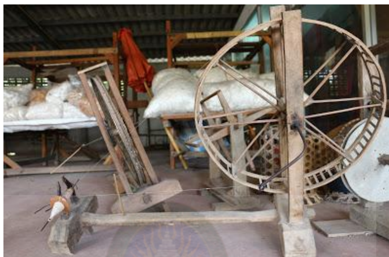
ภาพที่ 2.26 แสดงภาพของกงกวก (การศึกษาศิลปกรรมท้องถิ่น, 2556, เว็บไซต์)

3.7 กงกวก เป็นอุปกรณ์สำหรับคลี่เส้นฝ้ายเพื่อให้ง่ายต่อการทำมาป็นใส่กระบอก แสดงได้ดังภาพที่ 2.26