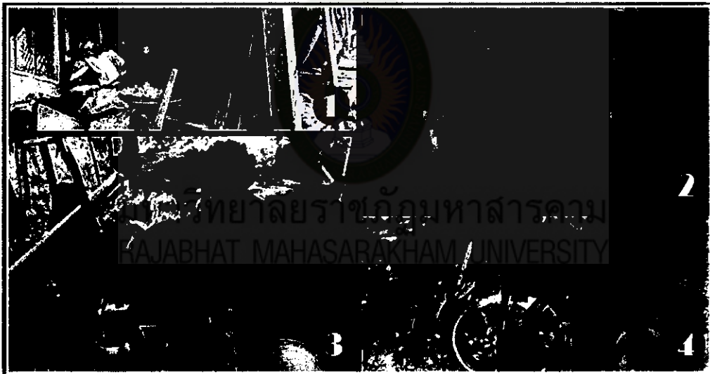
ภาพที่ 3 ขั้นตอนการสาวไหม