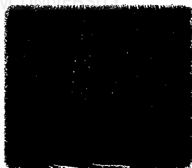
ภาพที่ 2 ผ้าไหมลาย โบราณสร้อยดอกหมาก