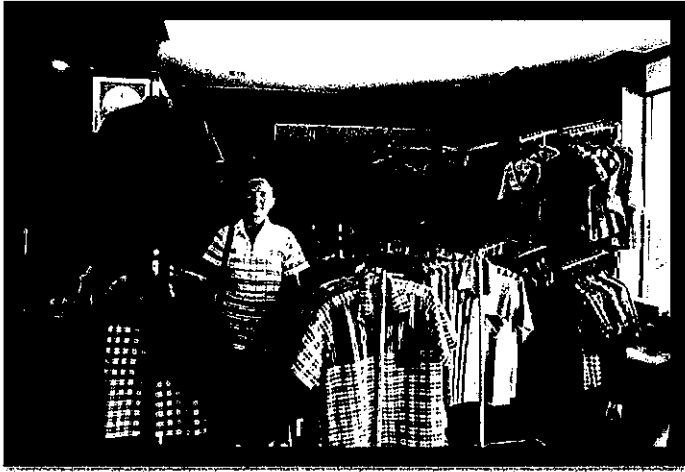
ภาพที่ 1 ร้านค้าจัดจำหน่ายผ้าไหมและผ้าพื้นบ้านตำบลท่าสองคอน

ชาวตำบลท่าสองคอน และชาวบ้านหนองเขื่อนช้างได้ดำเนินการทอผ้าพื้นเมือง และผลิตภัณฑ์งานประดิษฐ์จากสิ่งทอ ตั้งแต่อดีตเป็นต้นมา จากเดิมใช้ทอเป็นผ้าถุงใส่เป็น เครื่องนุ่งห่มธรรมดา ไม่ได้ขาย และต่อมาได้ดำเนินการอย่างจริงจัง เมื่อปี พ.ศ. 2514 โดยได้รับ คำแนะนำจากทางวิทยาลัยครูและสถาบันอื่นๆ ในเรื่องการออกแบบ เทคนิคการประดิษฐ์ เพื่อให้ตรงตามความต้องการของตลาด นอกจากทอผ้าแล้วยังได้นำเอาผ้าที่ทอแล้ว มาประดิษฐ์ ผลิตภัณฑ์ต่างๆ อีกเป็นจำนวนมาก ผลผลิตของชาวบ้านได้แก่