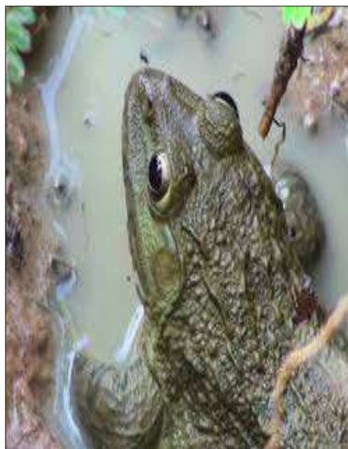
โครงการเลี้ยงกบ