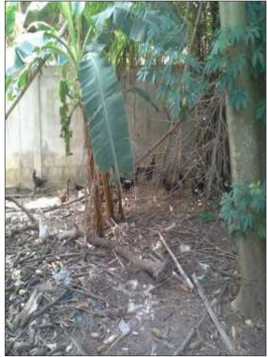
โครงการเลี้ยงไก่พันธุ์พื้นเมือง