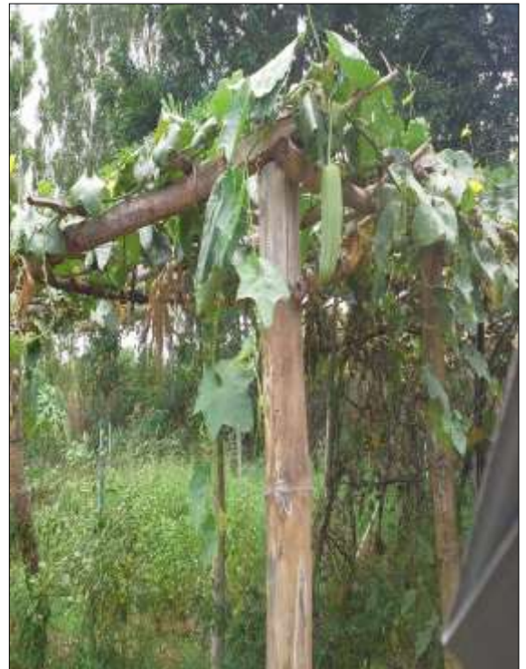
โครงการปลูกผักปลอดภัยจากสารพิษ