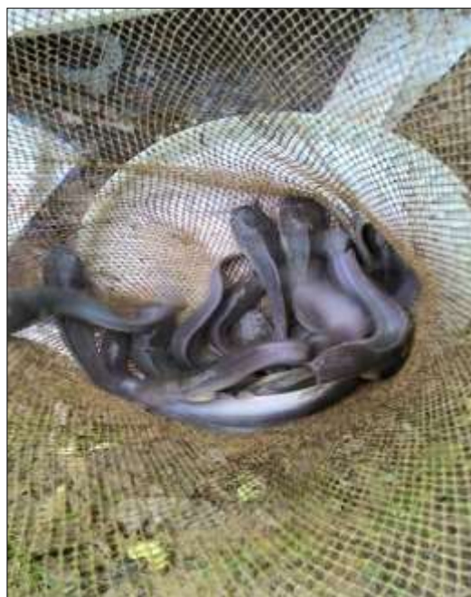
โครงการเลี้ยงปลาตุ๊ก