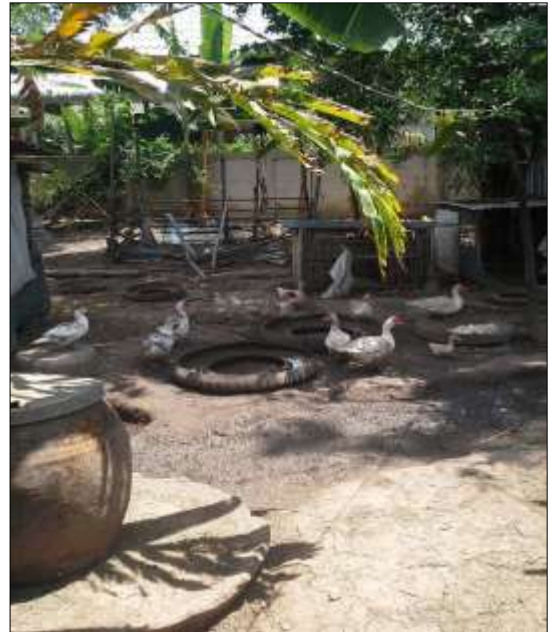
โครงการเลี้ยงเป็ด