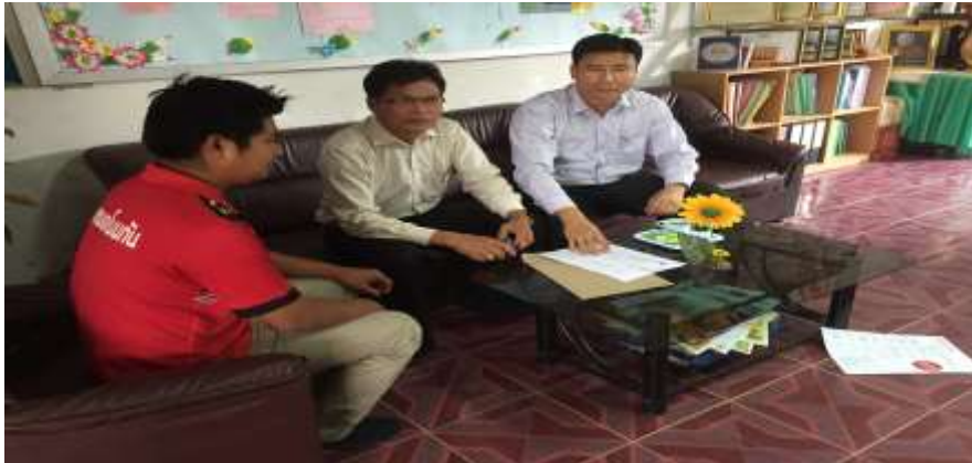
รูปภาพ การสนทนากลุ่ม (Focus Group Discussion)