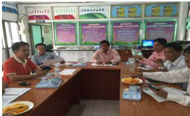
รูปภาพ การดำเนินงานตามการพัฒนาารูปแบบการบริหารสถานศึกษาขั้นพื้นฐานที่มี ประสิทธิผล เพื่อการประกันคุณภาพการศึกษา

มหาวิทยาลัยราชภัฏ RAJABHAT MAHASARAKHAM UNIVERSITY