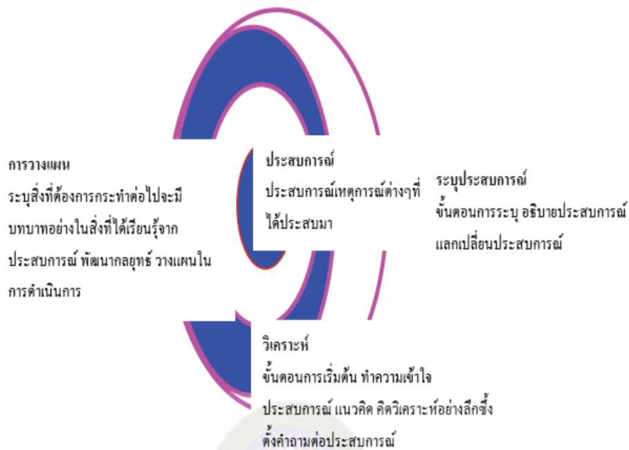
ภาพที่ 6 กระบวนการพัฒนาแบบมีส่วนร่วมโดยการเรียนรู้และการสะท้อนกลับ

ที่มา : อริศรา ชูชาติ และคณะ (2538 : 9-12)