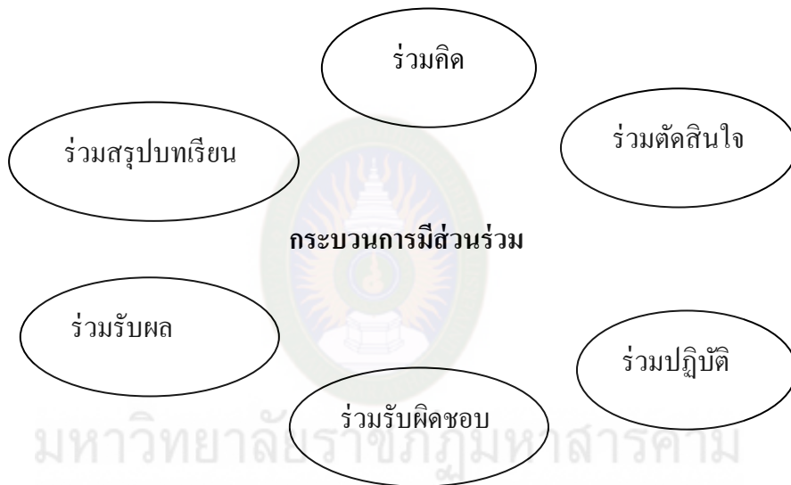
ภาพที่ 3 กระบวนการมีส่วนร่วม