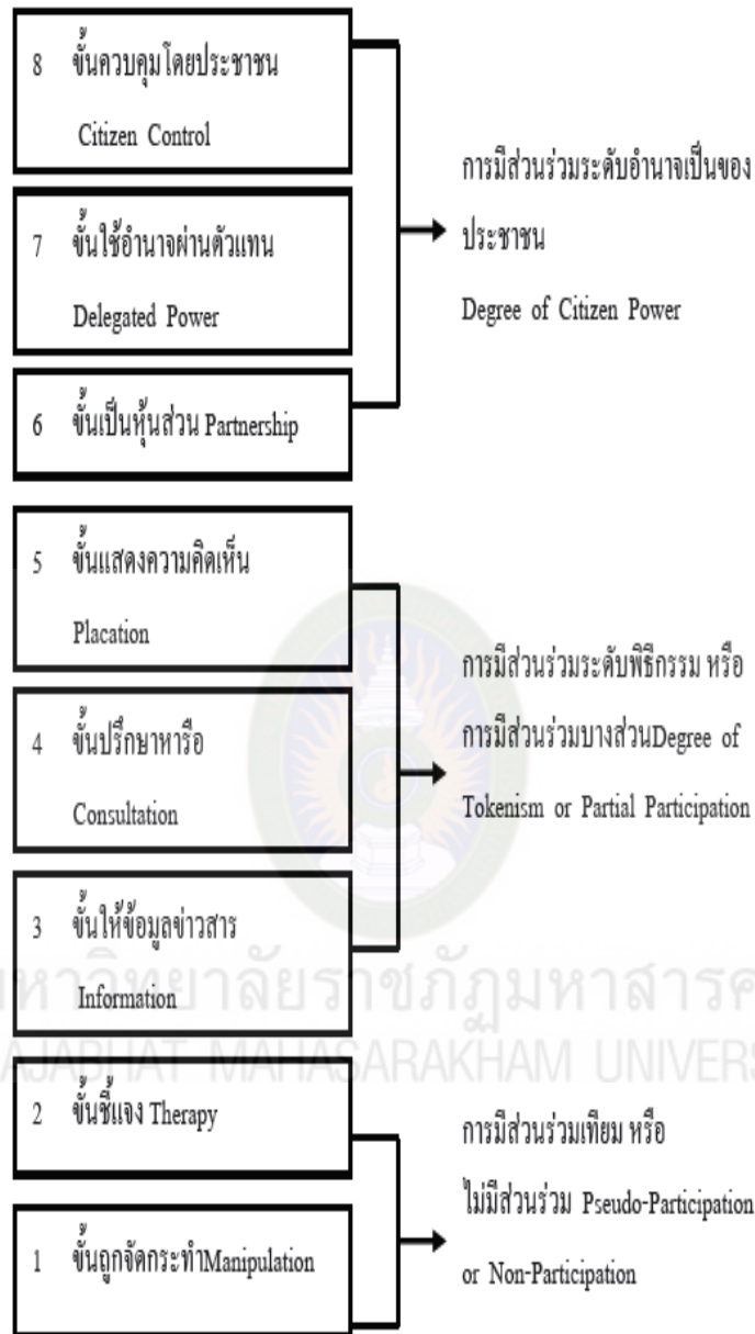
แผนภาพที่ 5 บันไดของการมีส่วนร่วม 8 ขั้น ของอาร์นสไตน์