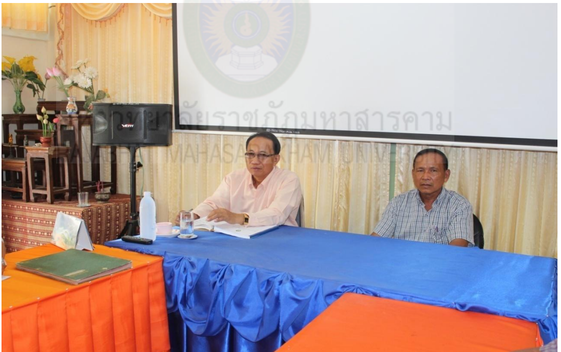
ภาพผนวกที่ 7-8 การจัดประชุมในการพัฒนาการดำเนินงานธนาคารโรงเรียนโลกประสิทธิ์วิทยา