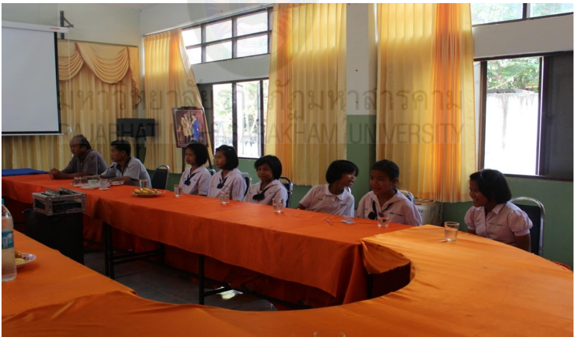
ภาพผนวกที่ 5-6 การจัดประชุมในการพัฒนาการดำเนินงานธนาคารโรงเรียนโลกประดิษฐ์วิทยา