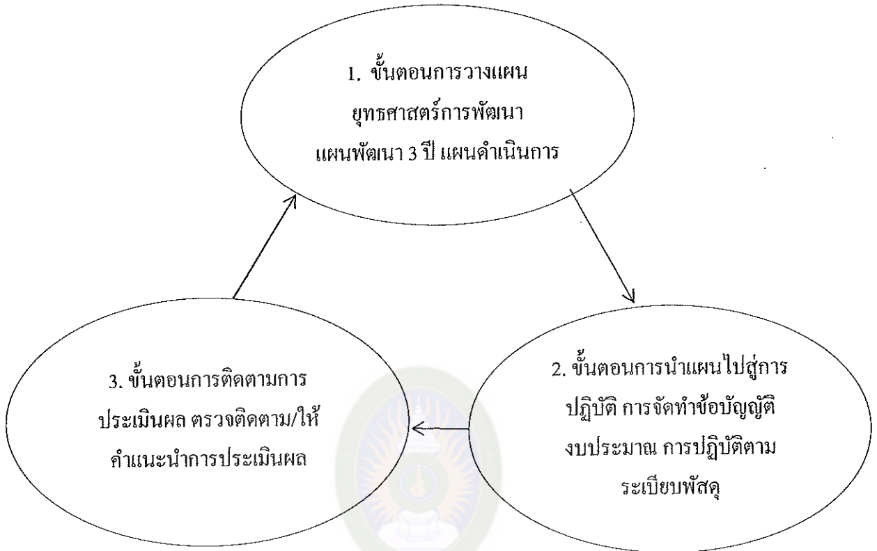
แผนภาพที่ 2 วงจรการวางแผนพัฒนาตำบล