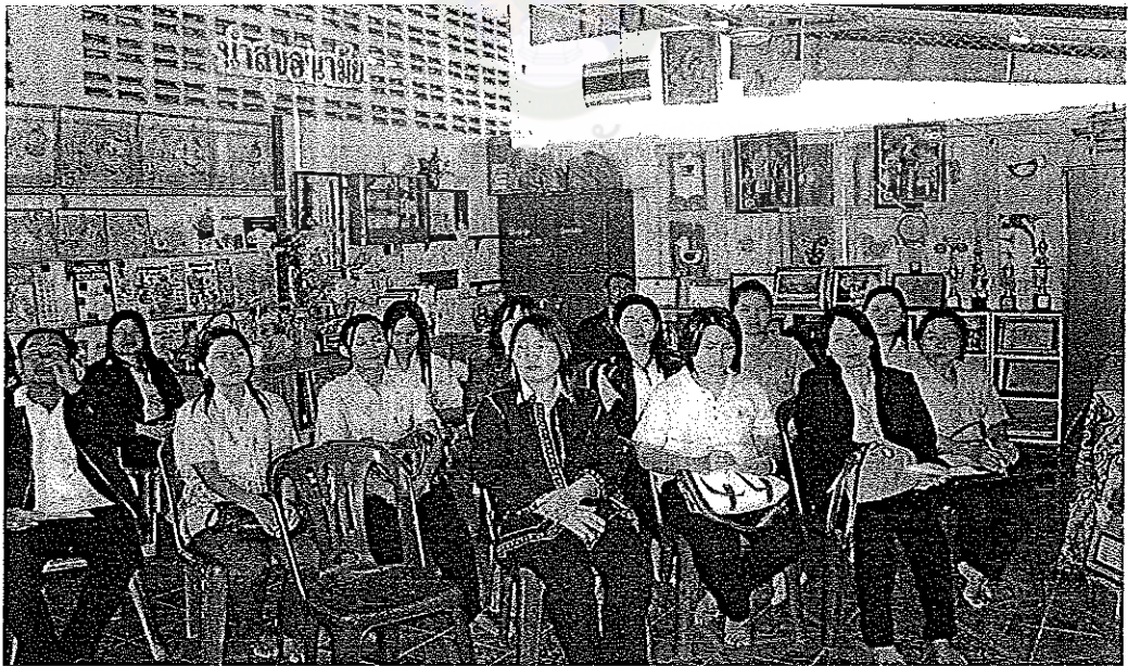
ภาพภาคผนวกที่ 2 การศึกษาสภาพการมีส่วนร่วมของผู้ปกครองในศูนย์พัฒนาเด็กเล็ก วัดสุวรรณคีรีวงศ์