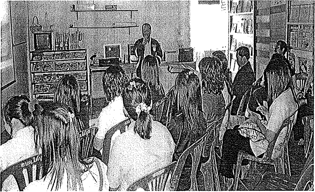
ภาพภาคผนวกที่ 1 การศึกษาสภาพการมีส่วนร่วมของผู้ปกครองในศูนย์พัฒนาเด็กเล็ก วัดสุวรรณคีรีวงศ์