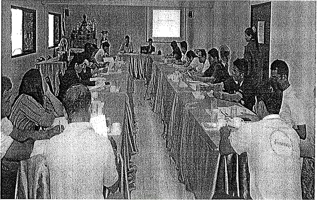
ภาพภาคผนวกที่ 3 การประชุมปฏิบัติการ