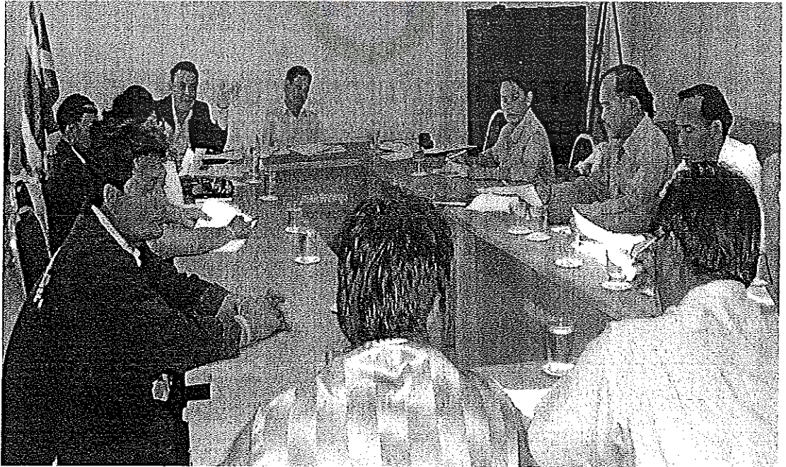
ภาพภาคผนวกที่ 4 การประชุมปฏิบัติการ