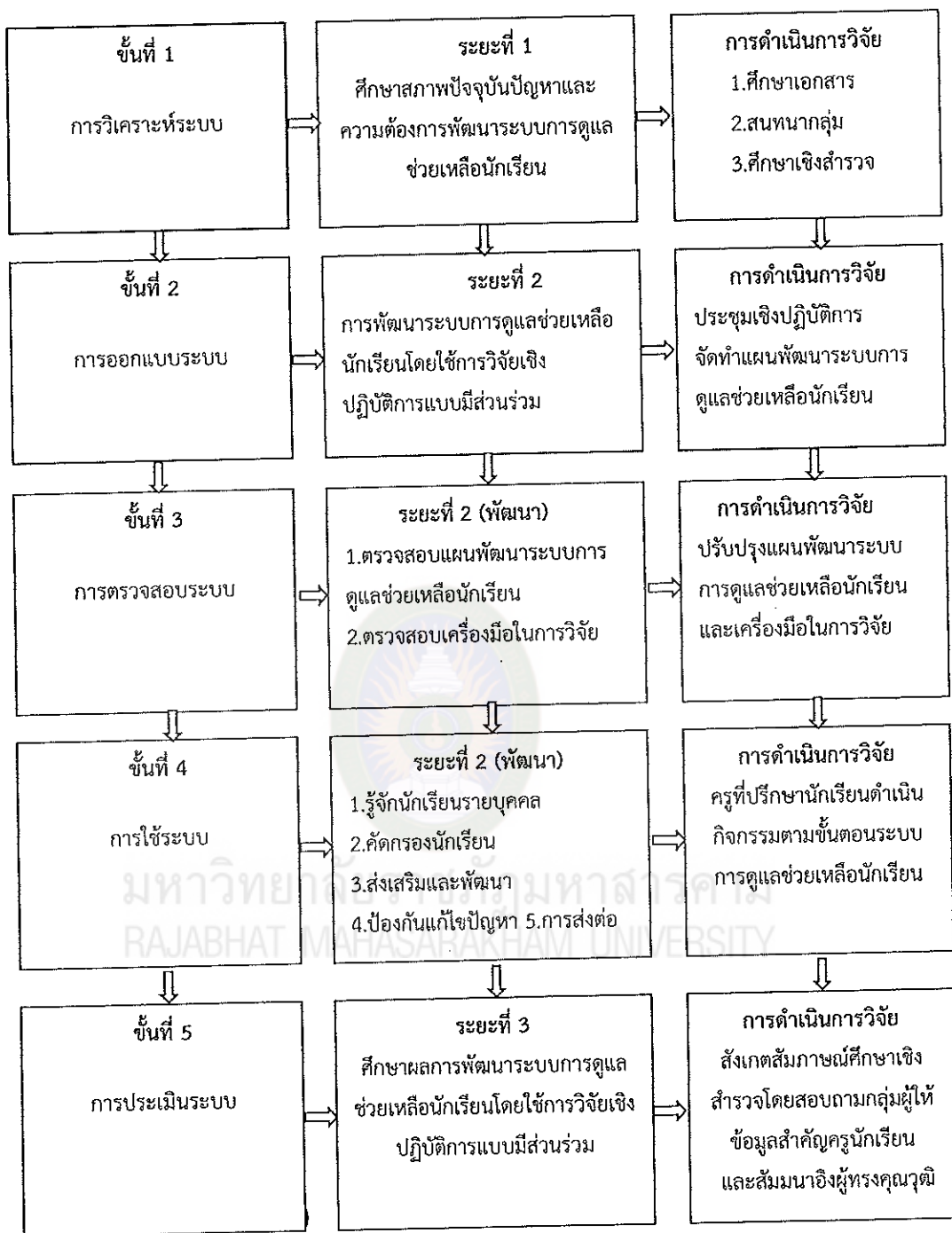
ภาพที่ 24 ความสัมพันธ์การพัฒนาระบบการดูแลช่วยเหลือนักเรียน โดยใช้การวิจัยเชิงปฏิบัติการแบบมีส่วนร่วม กับขั้นตอนในการดำเนินการวิจัย