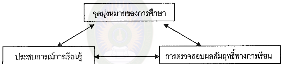
แผนภาพที่ 1 รูปแบบการประเมินหลักสูตรของไทเลอร์

3.7.1 รูปแบบการประเมินหลักสูตรของไทเลอร์ (Tyler's Model of Evaluation) ไทเลอร์ (Tyler, 1950 : 110 - 125) เป็นผู้ที่วางรากฐานการประเมินหลักสูตร โดยเสนอแนะแนวคิดว่า การประเมินหลักสูตรเป็นการเปรียบเทียบว่าพฤติกรรมของผู้เรียนที่เปลี่ยนแปลงไป เป็นไปตามจุดมุ่งหมายที่ได้ตั้งไว้หรือไม่ โดยการศึกษารายละเอียดขององค์ประกอบของกระบวนการจัดการศึกษา 3 ส่วนคือ จุดมุ่งหมายทางการศึกษา การจัดประสบการณ์การเรียนรู้ และการตรวจสอบผลสัมฤทธิ์ทางการเรียนของผู้เรียน ดังแผนภาพที่ 1