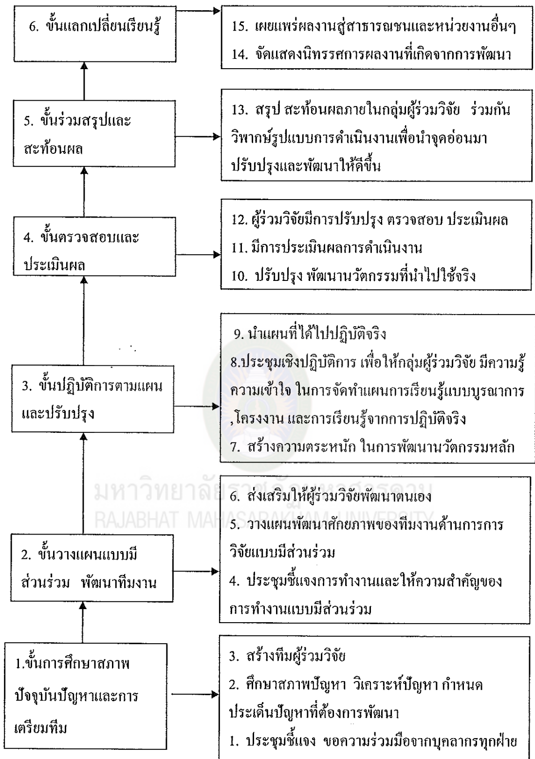
ภาพที่ 4 หลักการวิจัยปฏิบัติการแบบมีส่วนร่วม (PAR) ของ ฉลาด จันทรสมบัติ (2550 : 87)