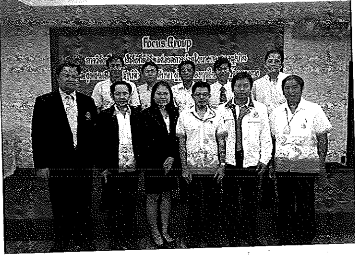
ภาพภาคผนวกที่ 2 ภาพการประชุมกลุ่มผู้เชี่ยวชาญ