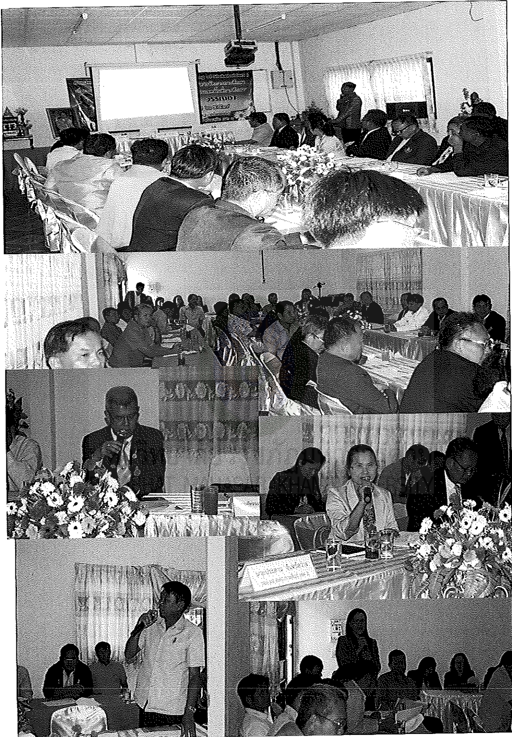
ภาพภาคผนวกที่ 8 ภาพประกอบการตรวจสอบและยืนยันโดยผู้มีส่วนได้ส่วนเสีย