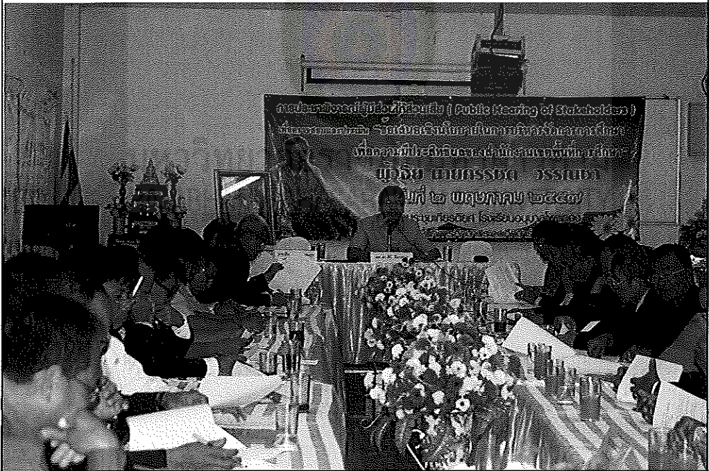
ภาพภาคผนวกที่ 7 ภาพประกอบการตรวจสอบและยืนยัน โดยผู้มีส่วนได้ส่วนเสีย วันที่ 2 พฤษภาคม 2557