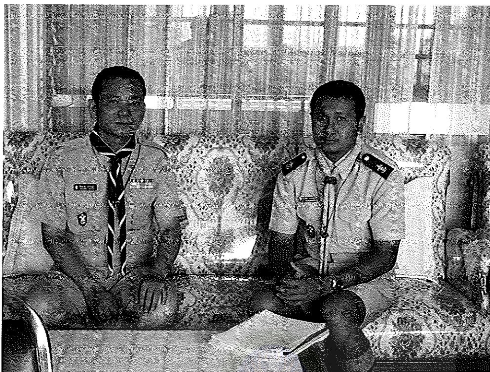
ภาพภาคผนวกที่ 1 การสัมภาษณ์ผู้อำนวยการลูกเสือ สำนักงานเขตพื้นที่การศึกษาประถมศึกษาหนองคาย เขต 2 (ผอ.สพป.นค. 2)