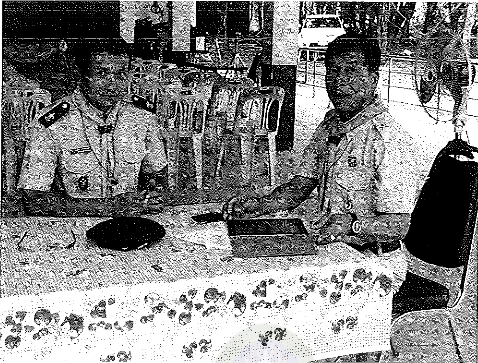
ภาพภาคผนวกที่ 3 การสัมภาษณ์ผู้ช่วยผู้ตรวจการประจำสำนักงานลูกเสือแห่งชาติ (สน.ชาย)