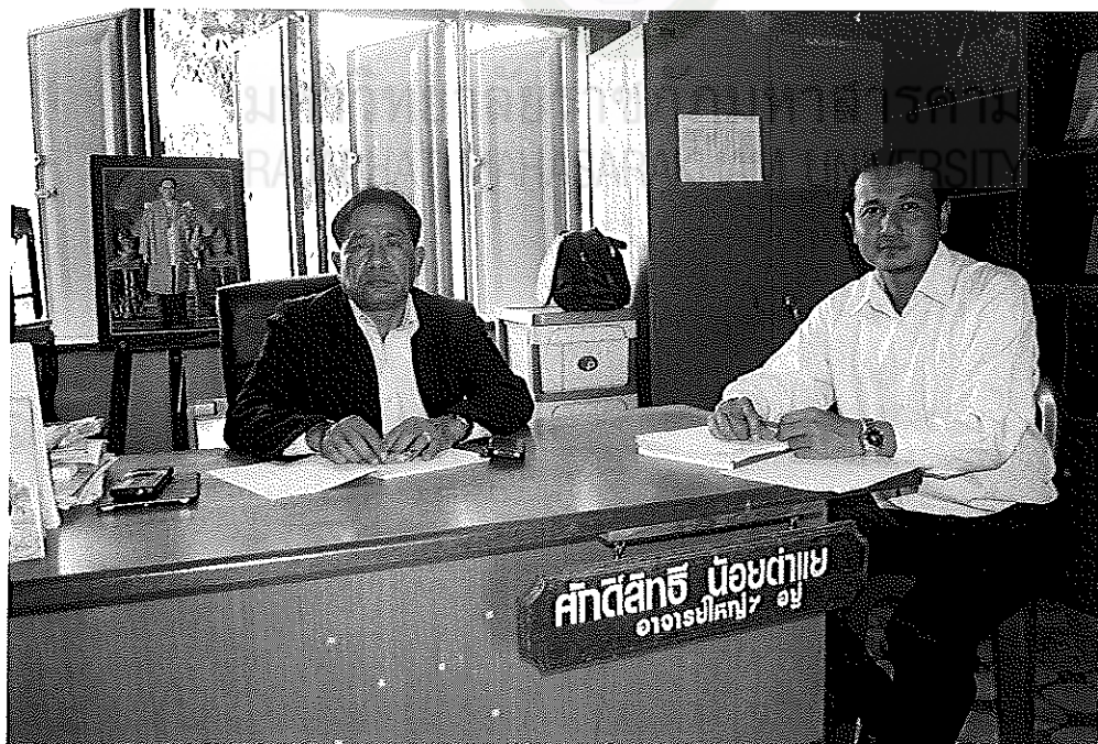
ภาพภาคผนวกที่ 2 การสัมภาษณ์ผู้ช่วยผู้ตรวจการประจำสำนักงานลูกเสือแห่งชาติ (ผอ.ร.ร.)