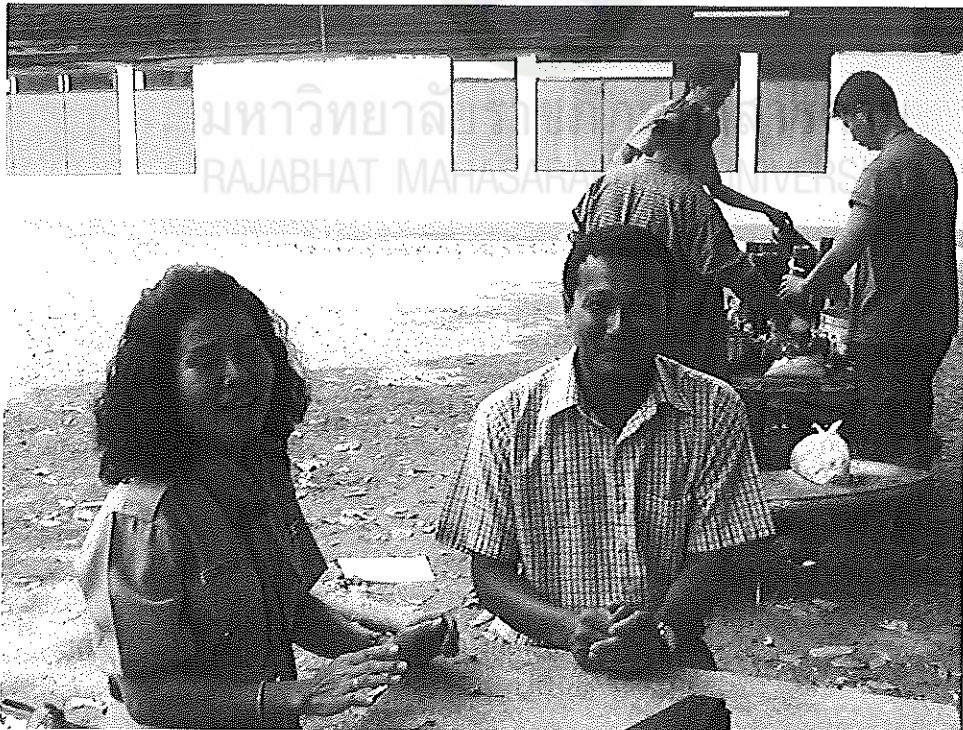
ภาพภาคผนวกที่ 4 การสัมภาษณ์ผู้ช่วยผู้ตรวจการประจำสำนักงานลูกเสือแห่งชาติ (สน.หญิง)