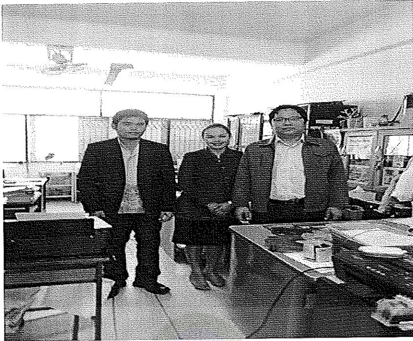
ภาพประกอบสัมภาษณ์ประชากรกลุ่มตัวอย่าง (ครูผู้รับผิดชอบด้านบริหารงานทั่วไป)