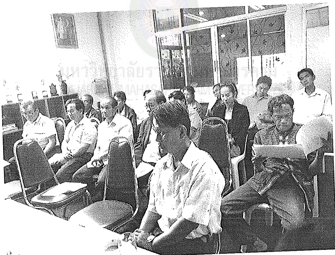
ภาพภาคผนวกที่ 7 การประชุมประชาพิจารณ์ผู้มีส่วนได้ส่วนเสีย 19 ธันวาคม 2556 เวลา 08.30 น. ณ ห้องประชุมเทศบาลตำบลสงเปลือย