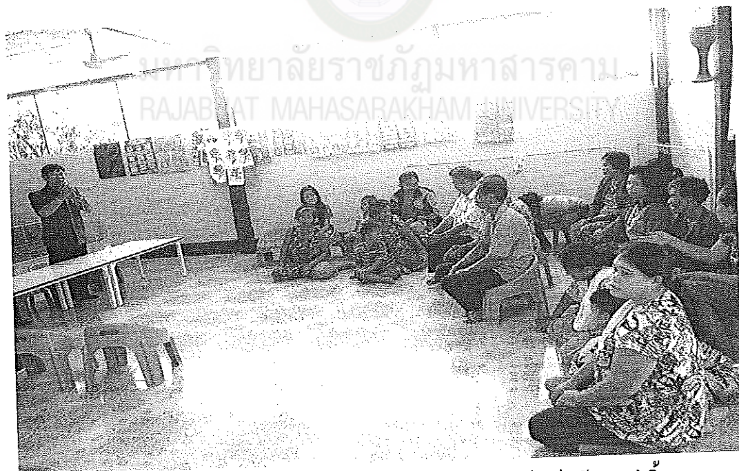
ภาพภาคผนวกที่ 6 การประชุมสนทนากลุ่มศูนย์พัฒนาเด็กเล็กบ้านเหล่าจิว 24 ตุลาคม 2556 เวลา 09.30 น. ณ ศูนย์พัฒนาเด็กเล็กบ้านเหล่าจิว