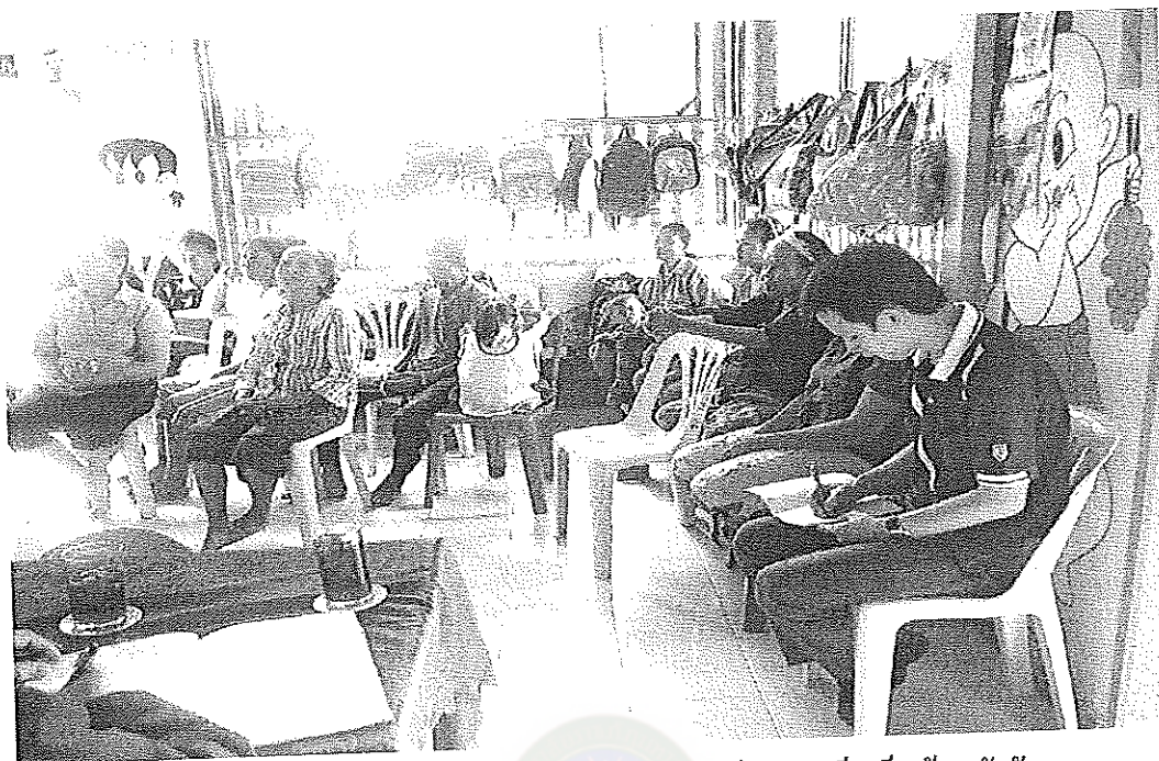
ภาพภาคผนวกที่ 3 การประชุมสนทนากลุ่มศูนย์พัฒนาเด็กเล็กบ้านห้วยจั่ว 15 ตุลาคม 2556 เวลา 09.40 น. ณ ศูนย์พัฒนาเด็กเล็กบ้านห้วยจั่ว