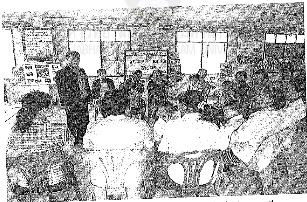
ภาพภาคผนวกที่ 4 การประชุมสนทนากลุ่มศูนย์พัฒนาเด็กเล็กบ้านหนองน้อย 17 ตุลาคม 2556 เวลา 09.30 น. ณ ศูนย์พัฒนาเด็กเล็กบ้านหนองน้อย