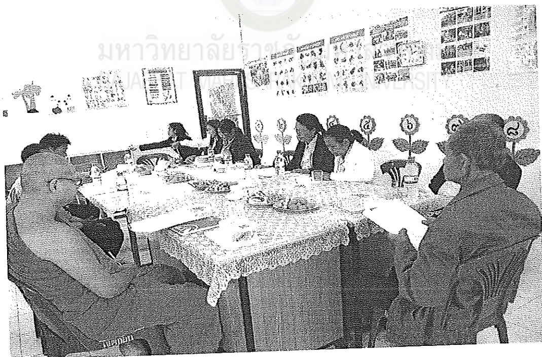
ภาพภาคผนวกที่ 2 การประชุมสนทนากลุ่มศูนย์วัดสุวรรณวาริหนองแขง 10 ตุลาคม 2556 เวลา 09.40 น. ณ ศูนย์วัดสุวรรณวาริหนองแขง