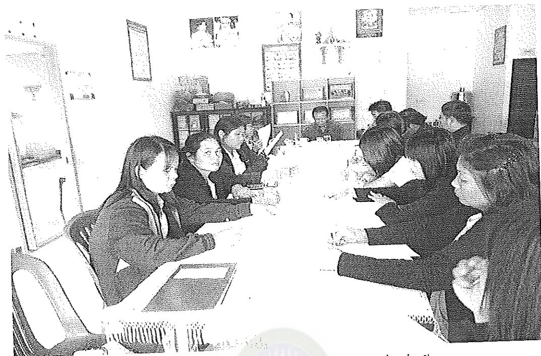
ภาพภาคผนวกที่ 1 การประชุมสนทนากลุ่มศูนย์พัฒนาเด็กเล็กบ้านดงสว่าง 8 ตุลาคม 2556 เวลา 09.30 น. ณ ศูนย์พัฒนาเด็กเล็กบ้านดงสว่าง