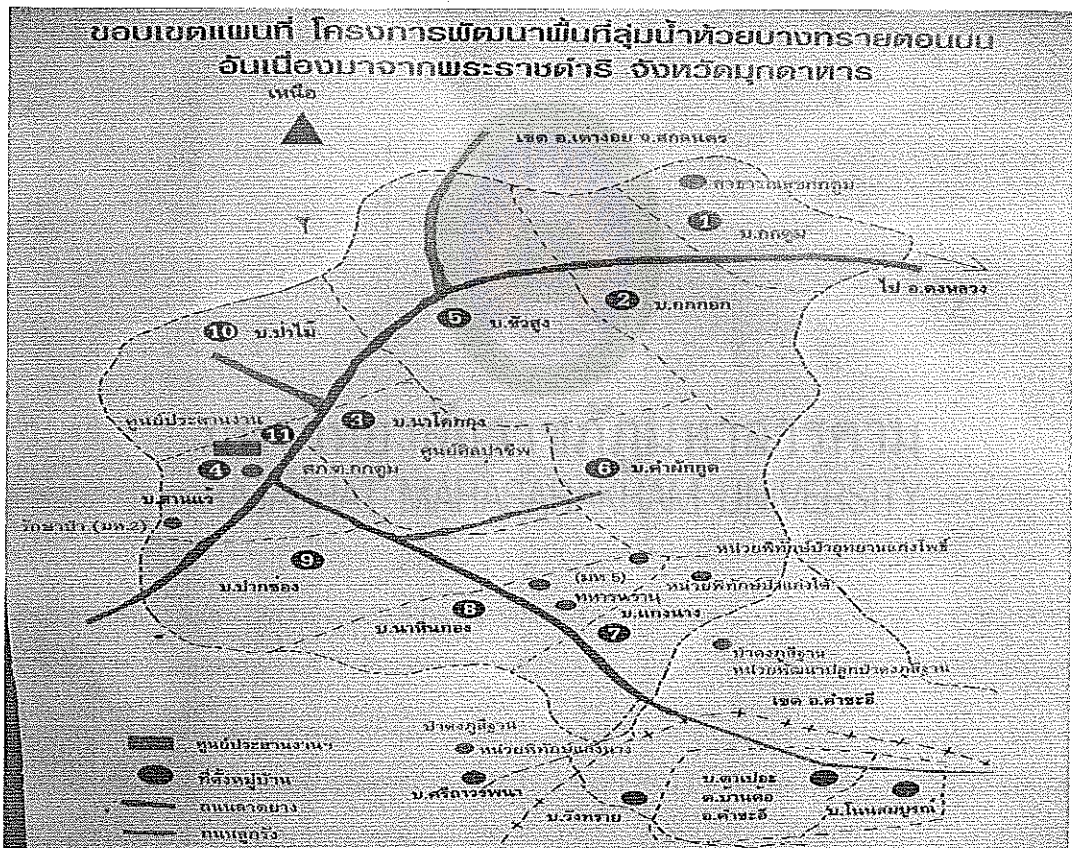
แผนภาพที่ 7 แผนที่อำเภอคำชะอี

รวมพื้นที่โครงการฯ ทั้ง 2 อำเภอ จำนวน ๑๘๔๐๐๐ ไร่