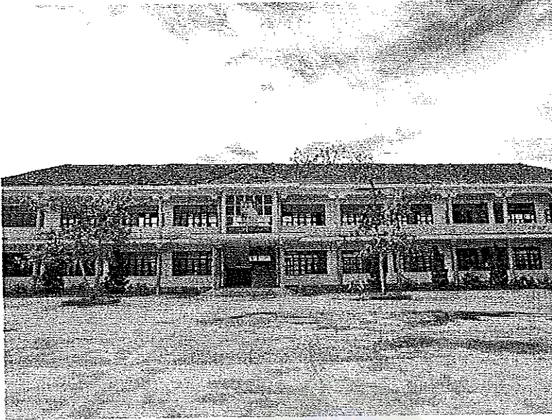
ภาพภาคผนวกที่ 3 บรรยากาศวันที่ไปแจกแบบสอบถาม ณ โรงเรียนมัธยม โช่ 2 กว่าง ตรั๊ด (Trường THPT số 2QuảngTrạch)