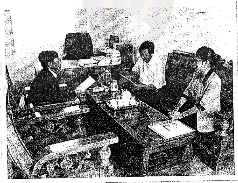
ภาพภาคผนวกที่ 2 บรรยากาศวันที่ไปแจกแบบสอบถาม ณ โรงเรียนมัธยม โซ่ 5 กว่าง ตรั๊ด (Trường THPT số 5 QuảngTrạch)