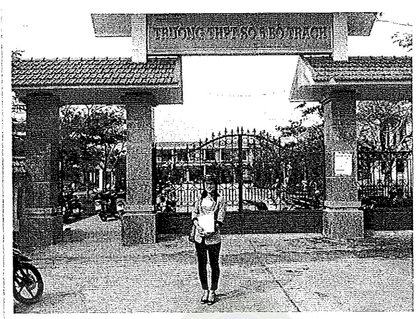
ภาพภาคผนวกที่ 5 บรรยากาศวันที่ไปแจกแบบสอบถาม ณ โรงเรียนมัธยม โซ่ 5 โบ้ ตร์ด (Truong THPT số 5 Bó Trạch)

มหาวิทยาลัยราชภัฏมหาสารคาม RAJABHAT MAHASARAKHAM UNIVERSITY