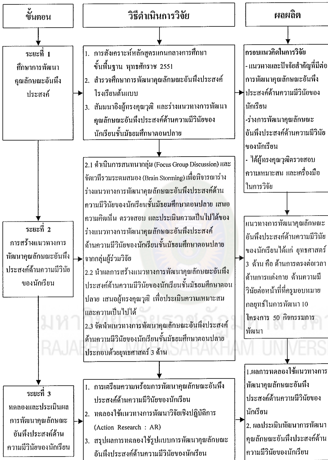
แผนภาพที่ 3 กรอบแนวคิดในการวิจัย