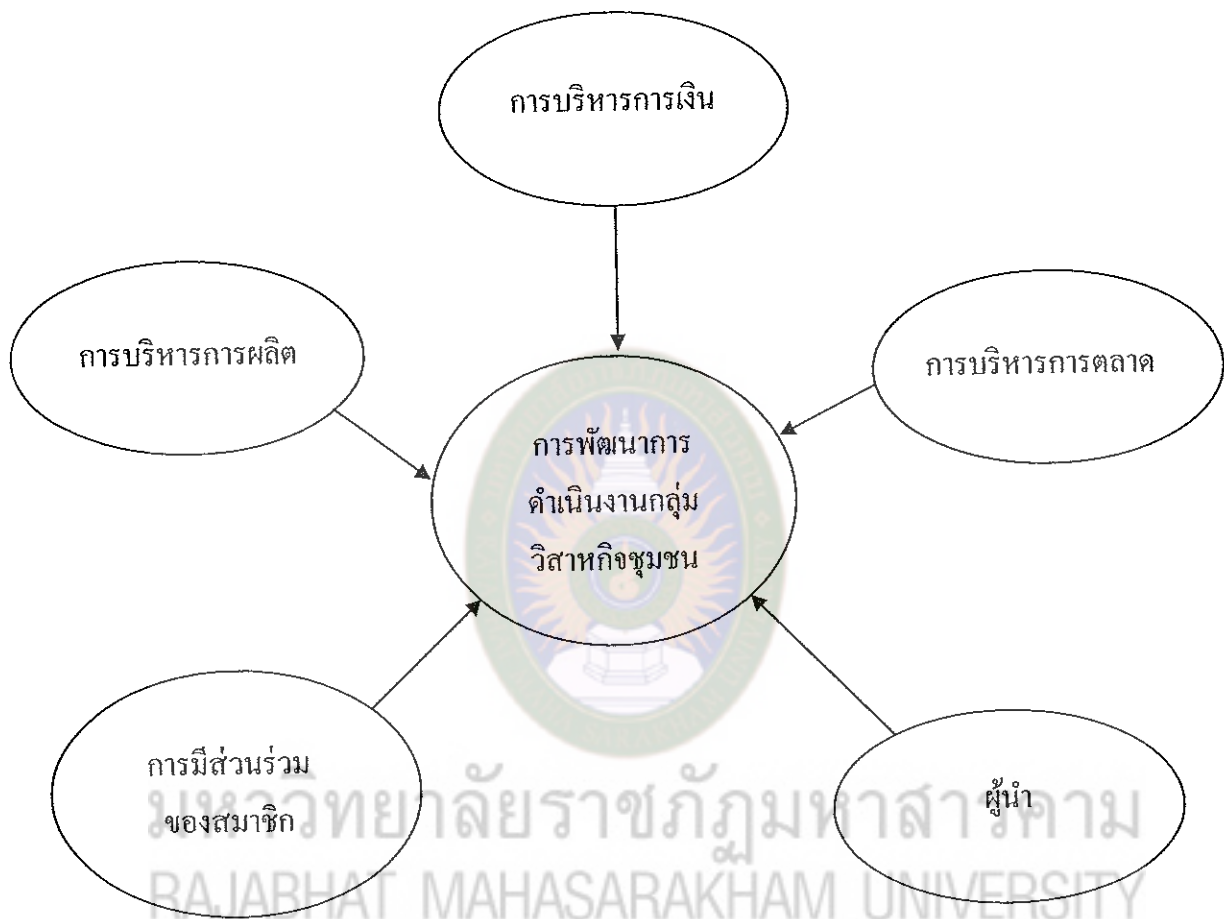
แผนภาพที่ 2 สรุปรูปแบบหลักสูตรการการฝึกอบรมการพัฒนาการดำเนินงานกลุ่มวิสาหกิจชุมชนในจังหวัดกาฬสินธุ์

สรุป จากผลการสร้างรูปแบบการพัฒนาการดำเนินงานกลุ่มวิสาหกิจชุมชนในจังหวัดกาฬสินธุ์ โดยการประชุมเชิงปฏิบัติการ (Workshop) ที่ผ่านการวิพากษ์วิจารณ์จากนักวิชาการ และผู้ที่เกี่ยวข้องกับการพัฒนาวิสาหกิจชุมชน สรุปแบบการพัฒนาดังแผนภาพที่ 2