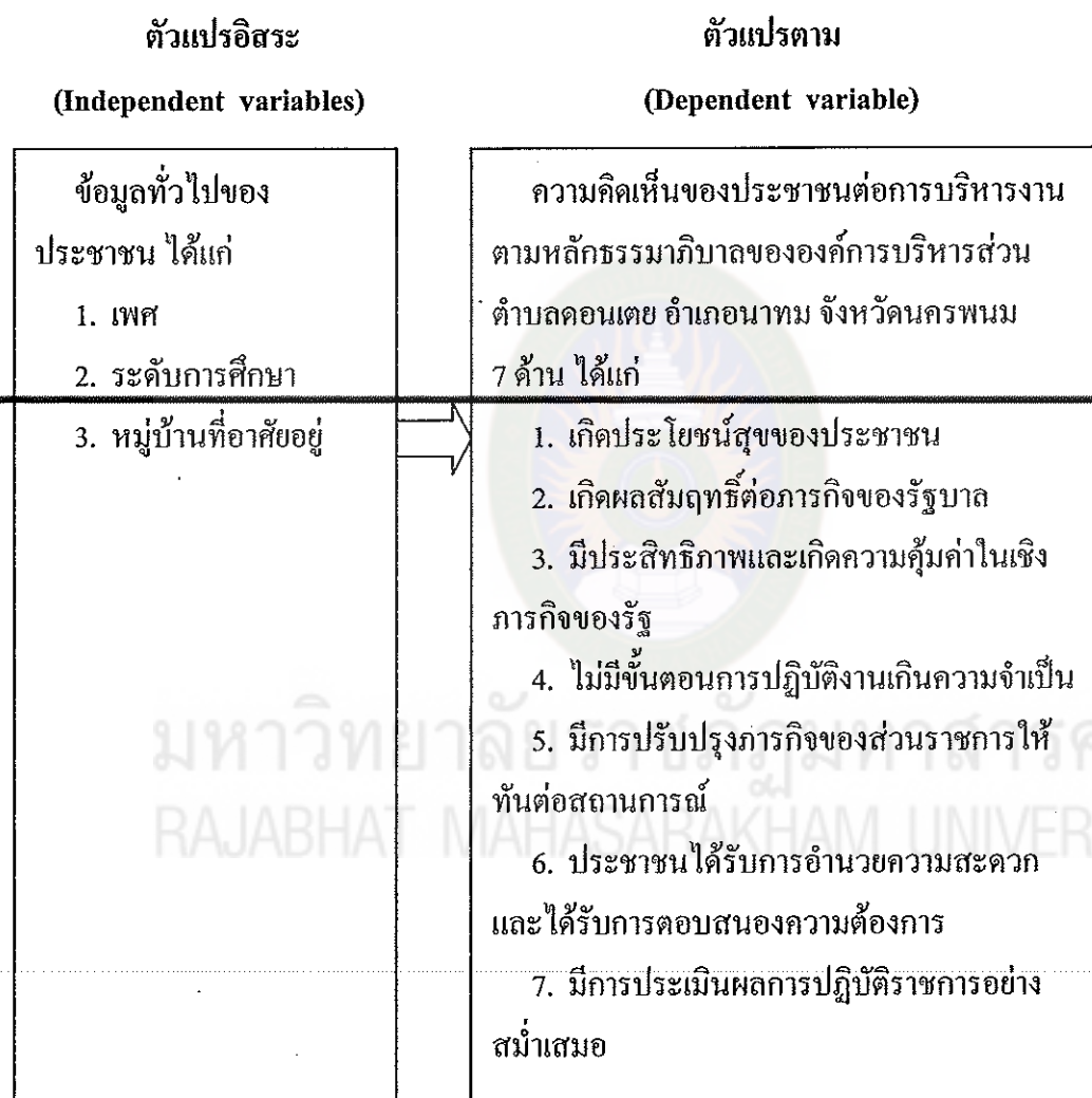
แผนภาพที่ 2 กรอบแนวคิดการวิจัย

จากการศึกษาแนวคิดทฤษฎีและงานวิจัยที่เกี่ยวข้อง ผู้วิจัยได้นำหลักการบริหารงานตามหลักธรรมาภิบาล ตาม พระราชกฤษฎีกาว่าด้วยหลักเกณฑ์และวิธีการบริหารกิจการบ้านเมืองที่ดี พ.ศ. 2546 มาใช้เป็นกรอบแนวคิดในการวิจัยเกี่ยวกับการบริหารงานตามหลักธรรมาภิบาลขององค์การบริหารส่วนตำบลคอนเตย อำเภอนาทม จังหวัดนครพนม ดังนี้