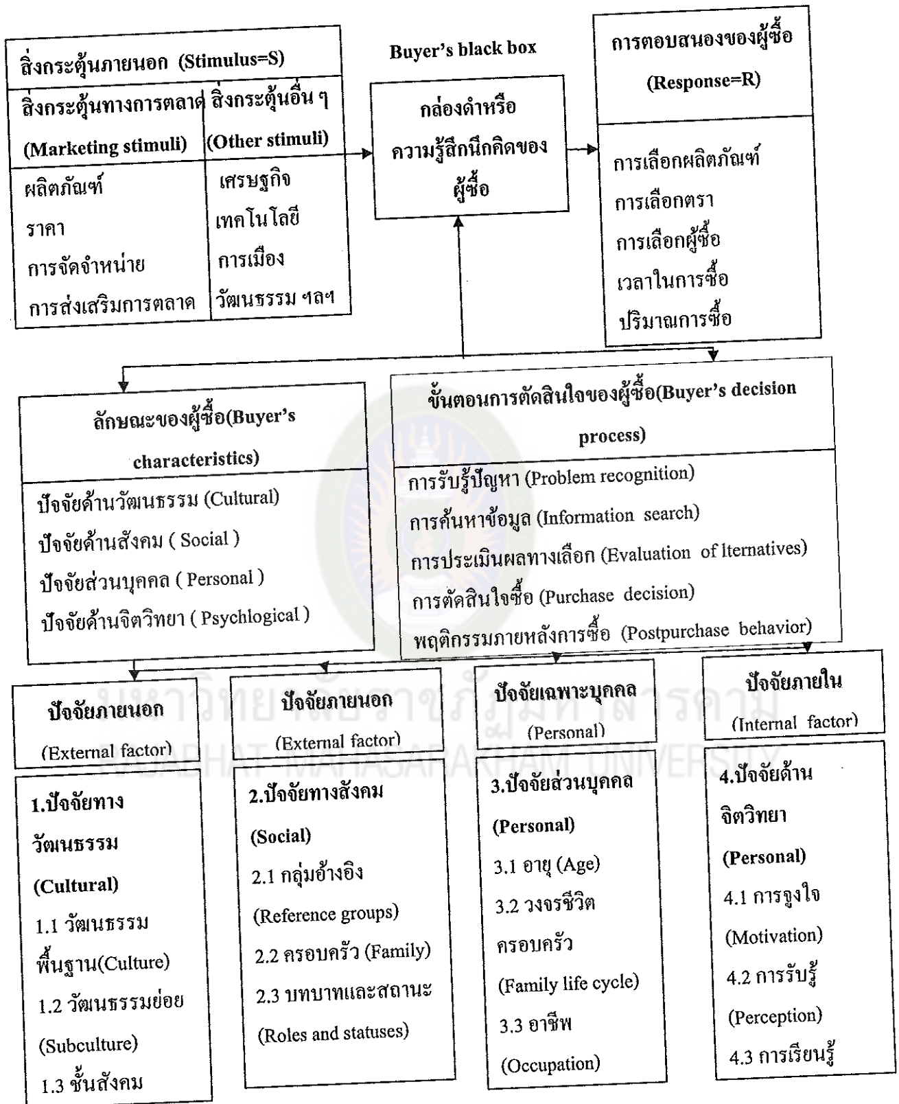
แผนภาพที่ 2 พฤติกรรมผู้ซื้อและปัจจัยที่มีอิทธิพลต่อพฤติกรรมการซื้อของผู้บริโภค