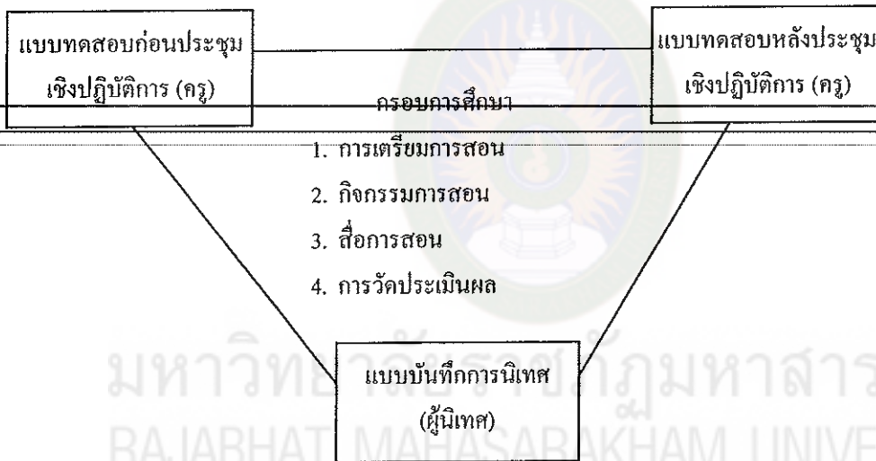
แผนภูมิที่ 4 กระบวนการจัดกิจกรรมหลักสามเส้าด้านวิธีการ

1.2 ข้อมูลเชิงปริมาณ ได้แก่ แบบสอบถามการสอนของครู และแบบประเมินการจัดทำแผนการจัดประสบการณ์การเรียนรู้ นำมาหาค่าเฉลี่ย (Mean) และส่วนเบี่ยงเบนมาตรฐาน (Standard Deviation)