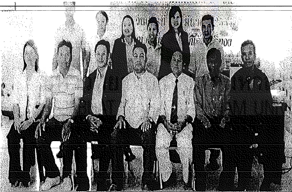
การนิเทศภายใน/กิจกรรมเพื่อนช่วยเพื่อน