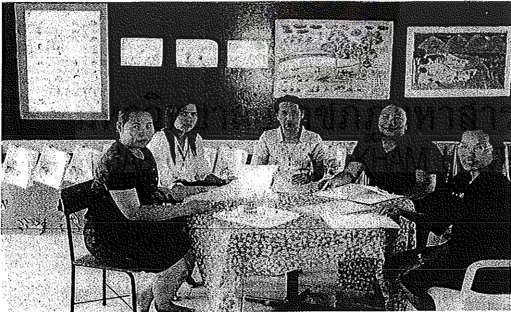
การนิเทศภายใน/กิจกรรมเพื่อนช่วยเพื่อน