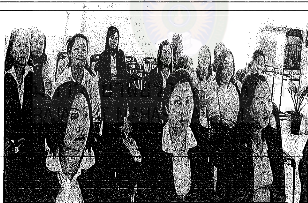
การประชุมเชิงปฏิบัติการ