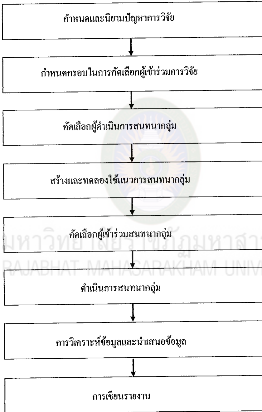
ภาพที่ 4 แผนภูมิแสดงขั้นตอนในการออกแบบการจัดสนทนากลุ่ม

9. การวิจัยแบบสนทนากลุ่มมีขั้นตอนและการออกแบบเหมือนการวิจัยทั่ว ๆ ไป ตั้งแต่เริ่มการกำหนดประเด็นปัญหาจนถึงการเขียนรายงาน เพียงแต่การสนทนากลุ่มมีหลักการเฉพาะในรายละเอียดของแต่ละขั้นตอนการวิจัย โดยสรุปขั้นตอนการวิจัยแบบสนทนากลุ่มไว้ดังภาพที่ 4