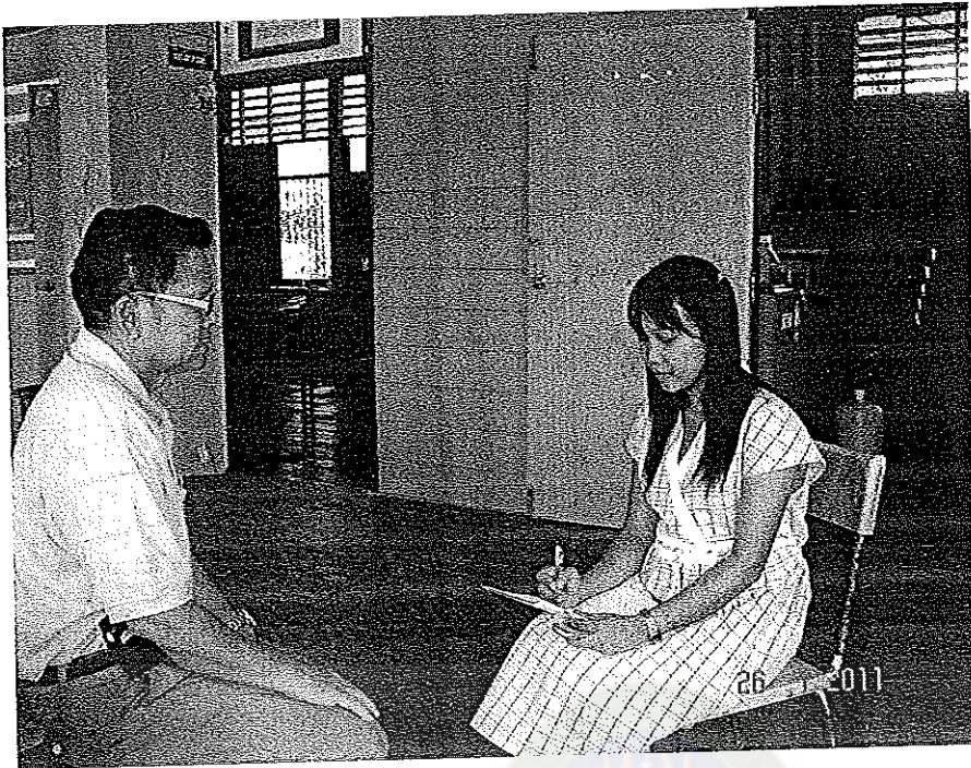
การสัมภาษณ์เชิงลึก