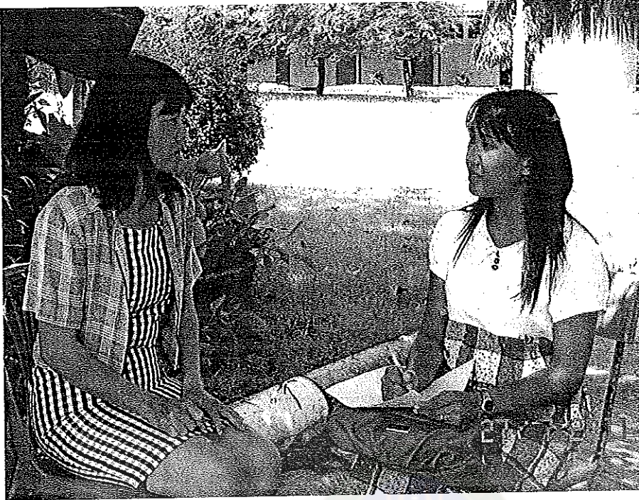
การสัมภาษณ์เชิงลึก