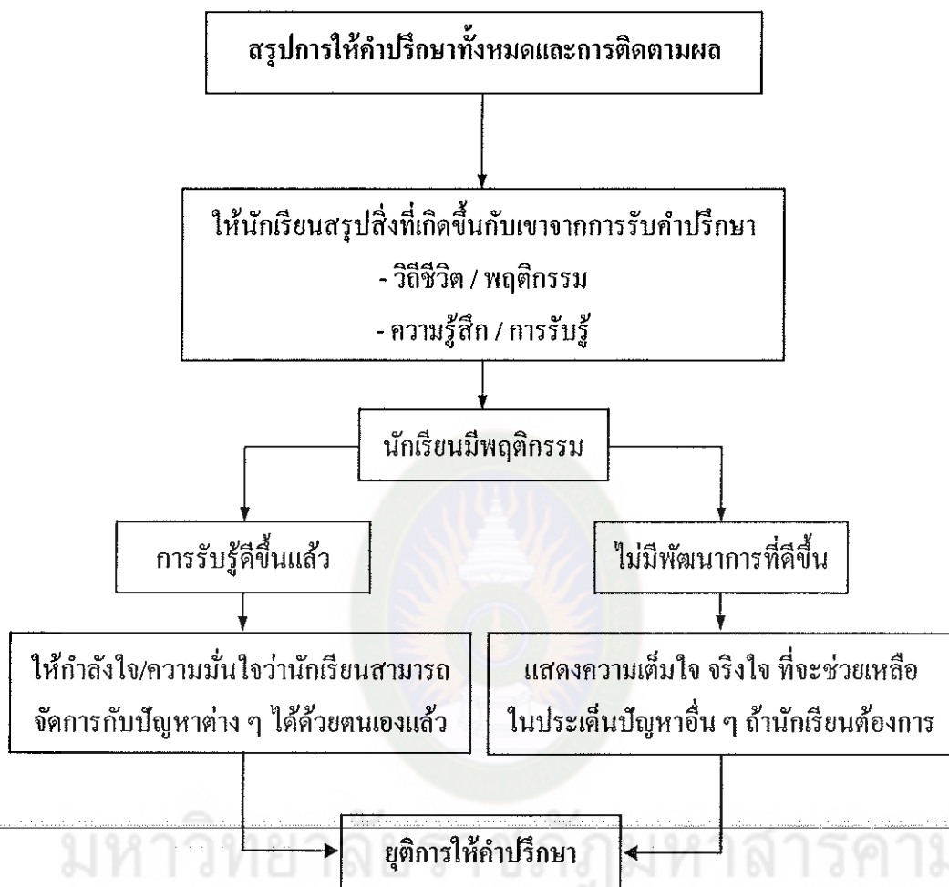
แผนภาพที่ 5 แสดงการสรุปประเมินผลและยุติการให้คำปรึกษา