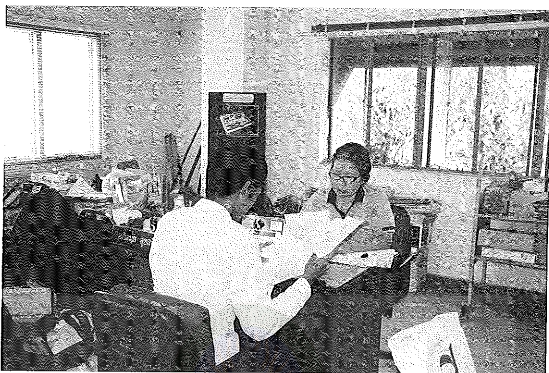
ภาพภาคผนวกที่ 1 สอบถามครูผู้สอน