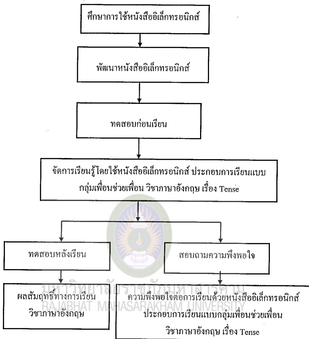
แผนภาพที่ 3 กรอบแนวคิดในการวิจัย