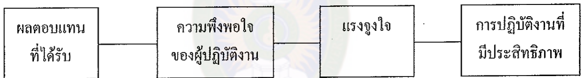
ภาพที่ 2 ความพึงพอใจนำไปสู่ผลการปฏิบัติงานที่มีประสิทธิภาพ

จากแนวคิดดังกล่าว ครูผู้สอนที่ต้องการให้กิจกรรมการเรียนรู้นั้นผู้เรียนเป็นศูนย์กลางบรรลุผลสำเร็จ จึงต้องคำนึงถึงการจัดบรรยากาศและสถานการณ์รวมทั้งสื่ออุปกรณ์ การเรียนการสอนที่เอื้ออำนวยต่อการเรียน เพื่อตอบสนองความพึงพอใจของผู้เรียนให้มีแรงจูงใจ ในการทำกิจกรรมจนบรรลุตามจุดประสงค์ของหลักสูตร