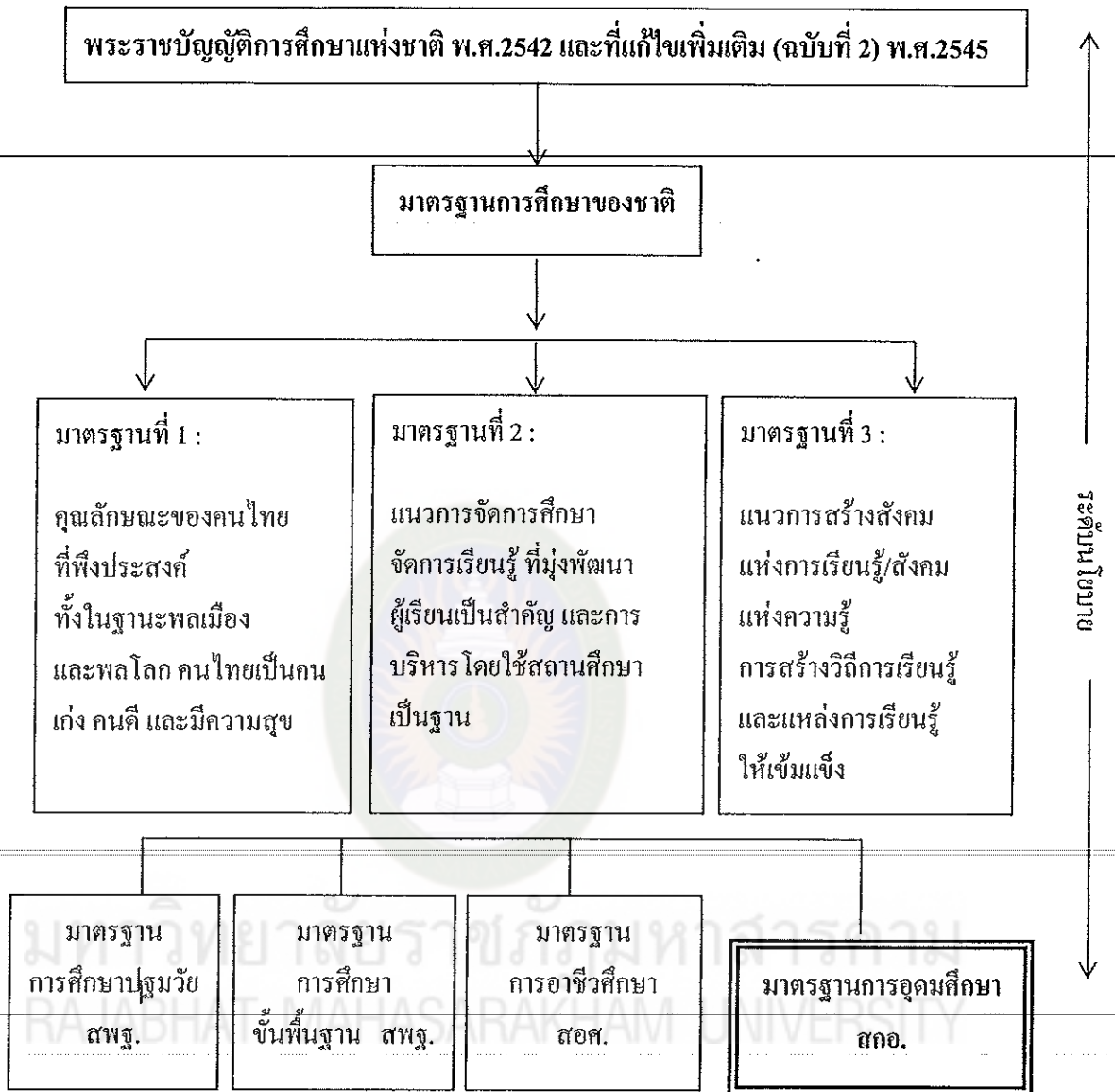
แผนภาพที่ 2 ความสัมพันธ์ของพระราชบัญญัติการศึกษาแห่งชาติ พ.ศ.2542 และที่แก้ไขเพิ่มเติม (ฉบับที่ 2) พ.ศ.2545