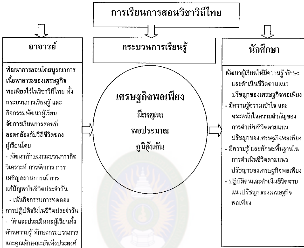
แผนภาพที่ 2 กรอบแนวคิด ความเชื่อมโยงของการพัฒนาการจัดการเรียนการสอนผ่านกระบวนการสร้างสำนักเศรษฐกิจพอเพียงในวิชาวิถีไทย