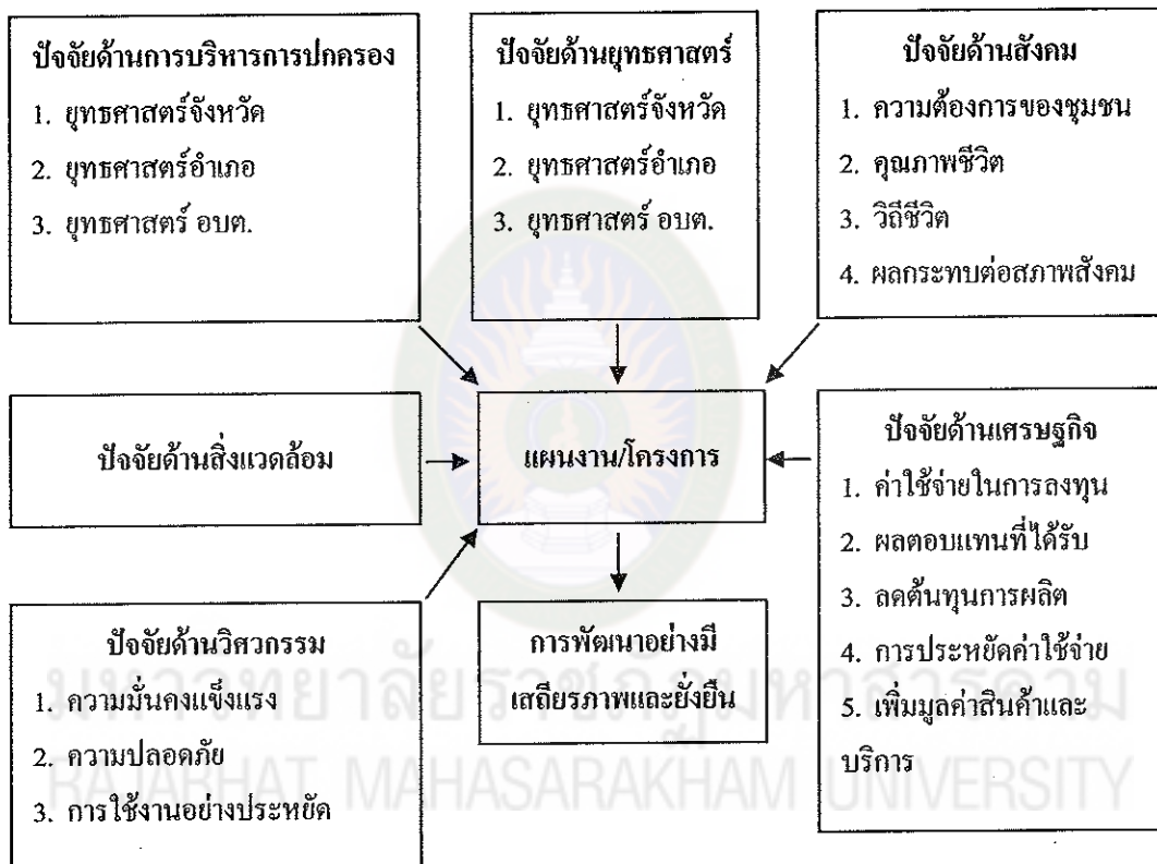
แผนภาพที่ 3 กรอบแนวคิดการวางแผนโครงการ