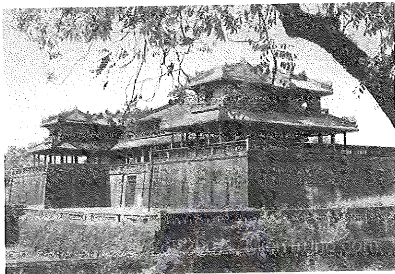
ภาพที่ 1 นครจักรพรรดิไดโนย