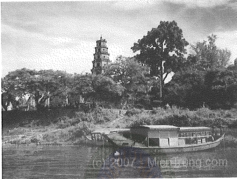
ภาพที่ 3 แม่น้ำหอม