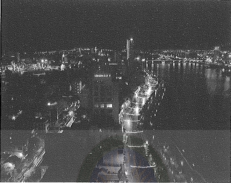
ภาพที่ 5 เมืองคานัง