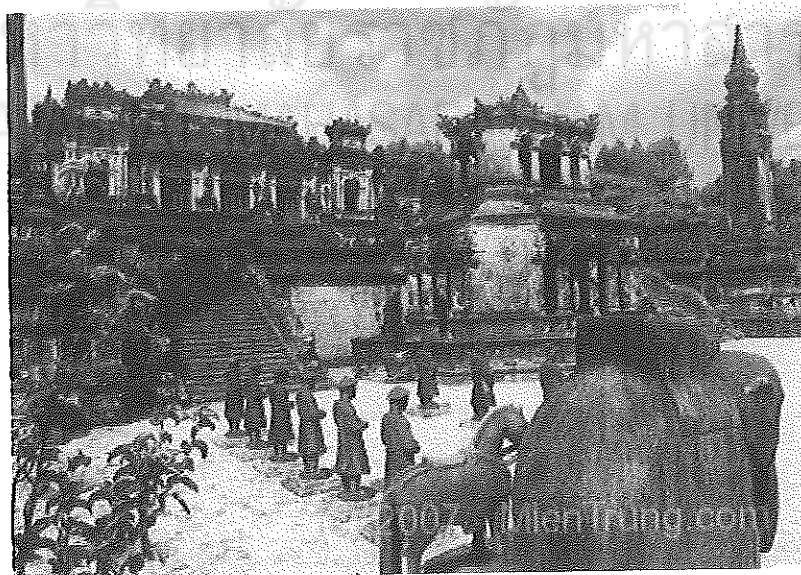
ภาพที่ 2 สุสานพระเจ้าไคดิงห์