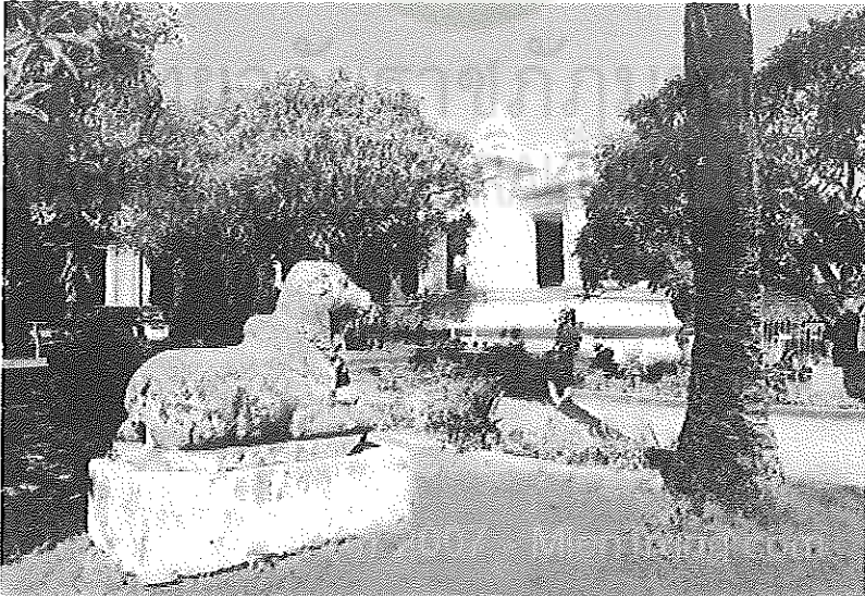
ภาพที่ 6 พระราชวังฤดูร้อนของจักรพรรดิเป๋าไต้