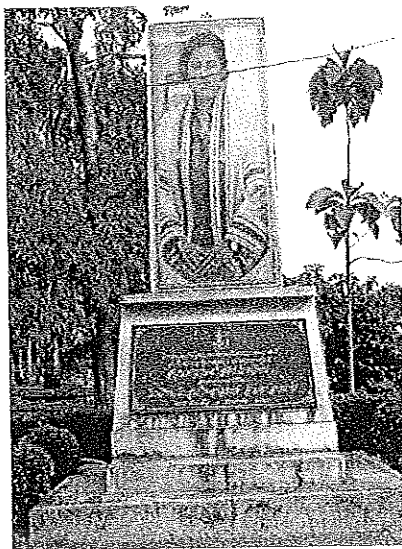
ภาพที่ 3 ป้ายพระราชทานงานสวนพฤกษศาสตร์โรงเรียน โกสุมวิทยาสรรค์