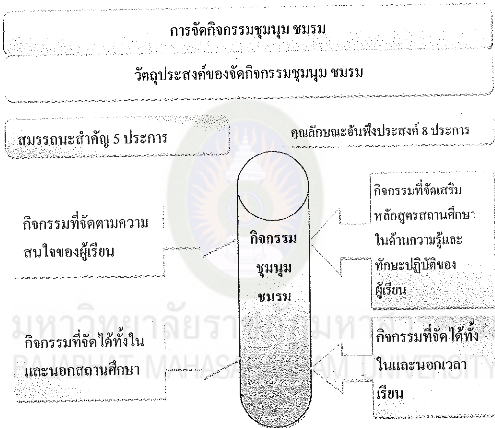
ภาพที่ 1 การจัดกิจกรรมชุมนุม ชมรม

กระทรวงศึกษาธิการ (2552 : 51-53) ได้ให้หลักการจัดกิจกรรมชุมนุม ชมรม ไว้ดัง ภาพที่ 1 ดังนี้