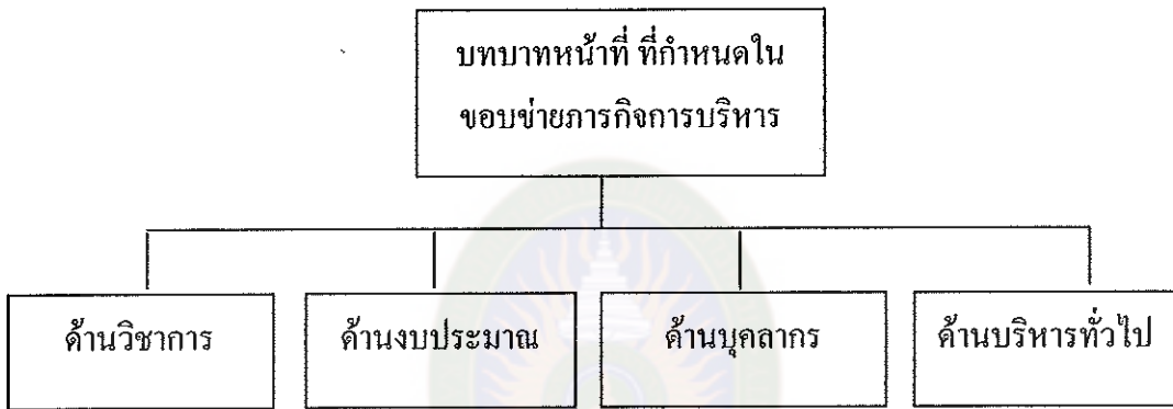
ภาพที่ 1 กรอบเนื้อหา

การวิจัยในครั้งนี้มีกรอบเนื้อหาของการพัฒนาการมีส่วนร่วมของคณะกรรมการสถานศึกษาตามบทบาทหน้าที่ที่กำหนด ตามขอบข่ายการบริหารสถานศึกษาในพระราชบัญญัติระเบียบบริหารราชการกระทรวงศึกษาธิการ พ.ศ.2546 และพระราชบัญญัติระเบียบข้าราชการครูและบุคลากรทางการศึกษา พ.ศ.2547 ดังภาพที่ 1