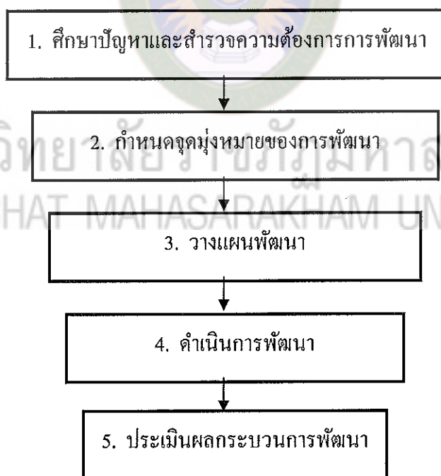
แผนภาพที่ 3 ขั้นตอนการพัฒนาบุคลากร

จากแนวความคิดที่กล่าวมาสรุปได้ว่า กระบวนการพัฒนาบุคลากรมีขั้นตอนเหมือนการดำเนินงานในด้านอื่น ๆ กล่าวคือ มีขั้นตอนโดยการศึกษาสภาพปัจจุบัน แล้วกำหนดเป้าหมายของการพัฒนาเพื่อวางแผนพัฒนา ดำเนินการพัฒนาและประเมินผลกระบวนการพัฒนาเพื่อเป็นแนวทางในการนำไปประยุกต์ใช้ต่อไป ดังแสดงในแผนภาพที่ 3