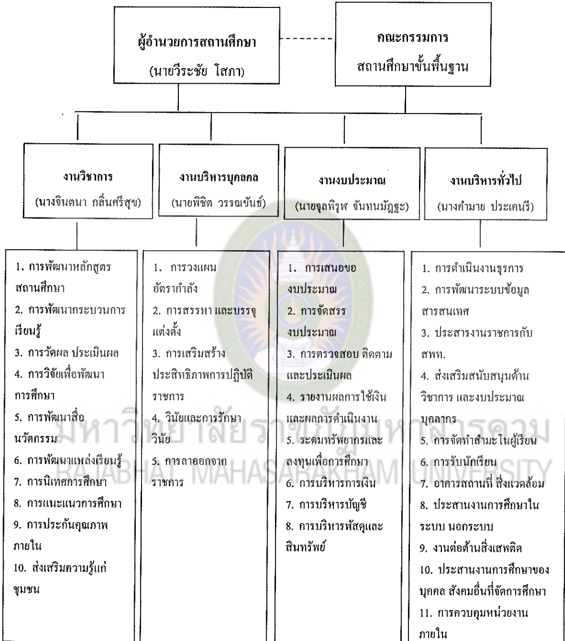
แผนภาพที่ 4 โครงสร้างการบริหาร โรงเรียนบ้านหนองแวง อำเภอเมือง สำนักงานเขตพื้นที่ศึกษามหาสารคาม เขต 1 ปีการศึกษา 2552