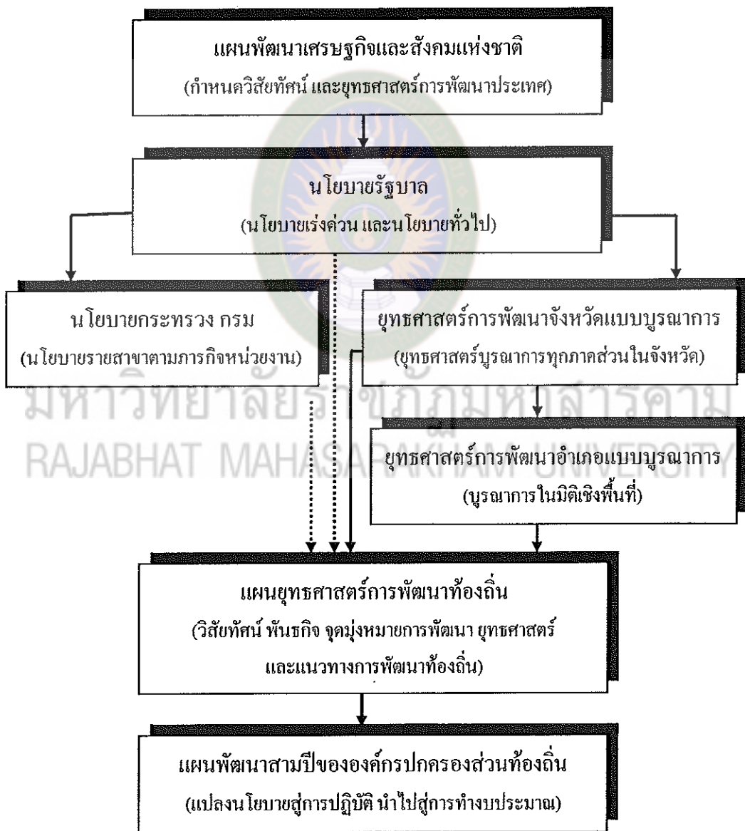
แผนภูมิที่ 3 ความสัมพันธ์ระหว่างแผนพัฒนาระดับต่างๆ กับแผนพัฒนาท้องถิ่น

ดังนั้น แผนยุทธศาสตร์การพัฒนาขององค์กรปกครองส่วนท้องถิ่น ซึ่งเป็นแผนพัฒนาระยะยาว 5 ปี จึงเป็นแผนพัฒนาเศรษฐกิจและสังคมขององค์กรปกครองส่วนท้องถิ่นที่กำหนดยุทธศาสตร์และแนวทางการพัฒนาขององค์กรปกครองส่วนท้องถิ่น ซึ่งแสดงถึงวิสัยทัศน์ พันธกิจและจุดมุ่งหมายเพื่อการพัฒนาในอนาคตโดยสอดคล้องกับแผนพัฒนาเศรษฐกิจและสังคมแห่งชาติ แผนพัฒนาจังหวัด แผนพัฒนาอำเภอ และนโยบายท้องถิ่น ดังแผนภูมิที่ 3