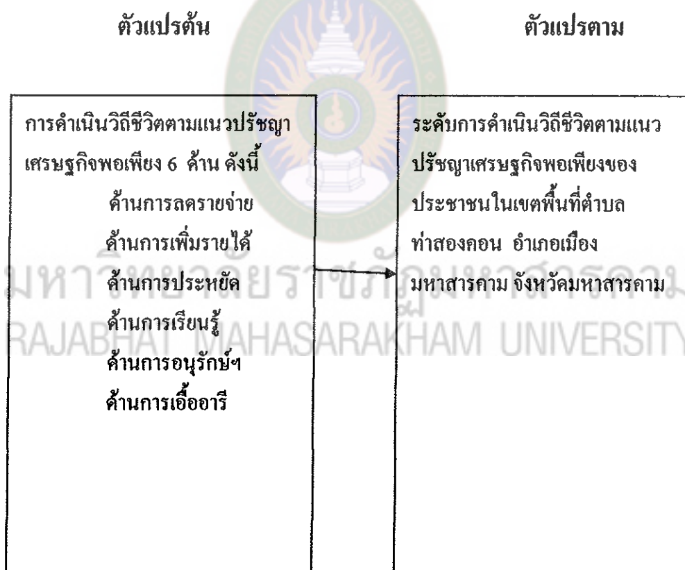
แผนภาพที่ 2 กรอบแนวคิดการศึกษา

การศึกษาการดำเนินวิถีชีวิตตามแนวปรัชญาเศรษฐกิจพอเพียงของประชาชน ในเขตพื้นที่ตำบลท่าสองคอน อำเภอเมืองมหาสารคาม จังหวัดมหาสารคาม ผู้ศึกษาใช้กรอบแนวคิดตามแนวทางขับเคลื่อนปรัชญาเศรษฐกิจพอเพียงกระทรวงมหาดไทยในการประยุกต์ใช้ปรัชญาเศรษฐกิจพอเพียง ระดับบุคคล ครอบครัว กลุ่ม เครือข่าย และชุมชน ตามยุทธศาสตร์การขับเคลื่อนปรัชญาเศรษฐกิจพอเพียงปี 2551-2554 (คณะกรรมการอำนวยการขับเคลื่อนปรัชญาของเศรษฐกิจพอเพียงของกระทรวงมหาดไทย : 1-55) 6 ด้าน ได้แก่ ด้านการลดรายจ่าย ด้านการเพิ่มรายได้ ด้านการประหยัด ด้านการเรียนรู้ ด้านการอนุรักษ์ และด้านการเอื้ออารี โดยเขียนเป็นกรอบแนวคิดการศึกษา ดังนี้