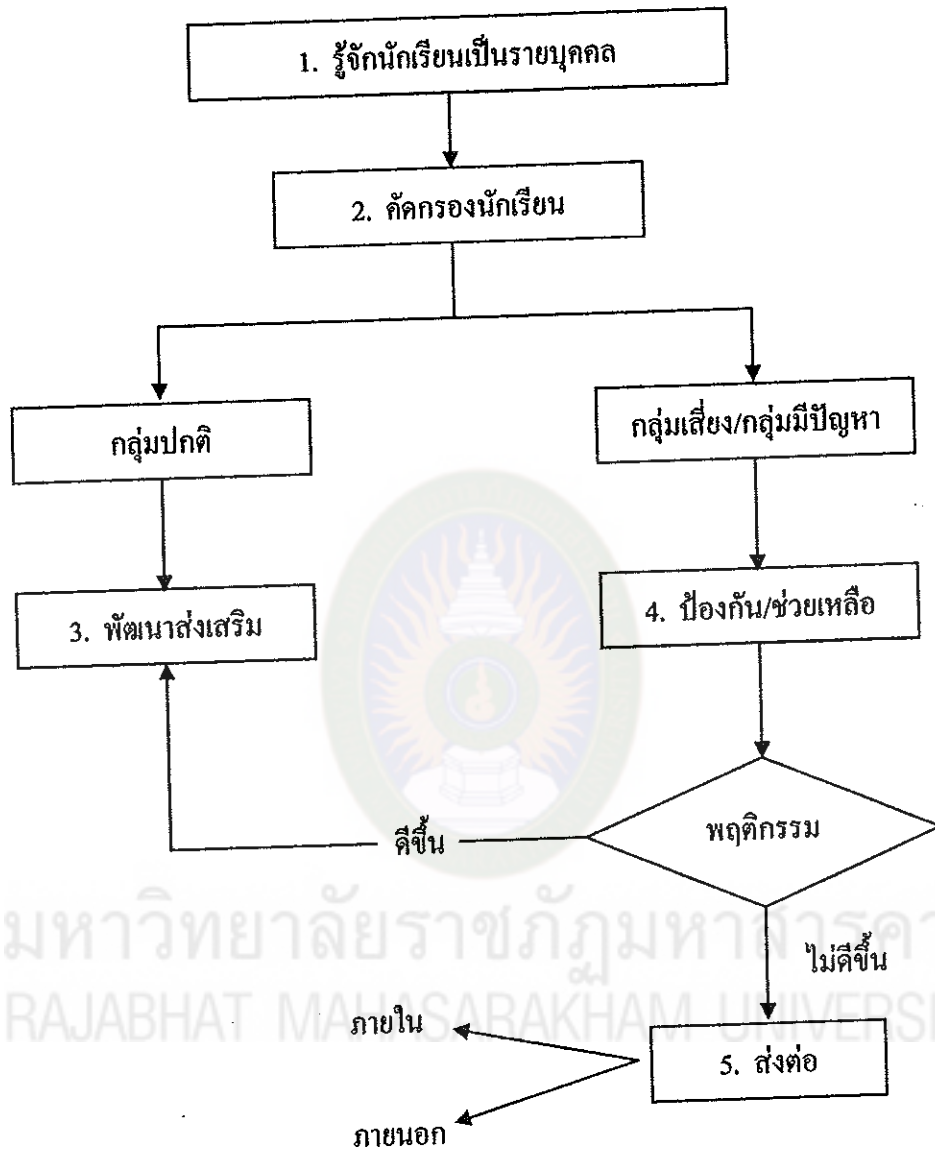
ภาพที่ 1 แสดงกระบวนการดำเนินงานตามระบบดูแลช่วยเหลือนักเรียนของครูที่ปรึกษา