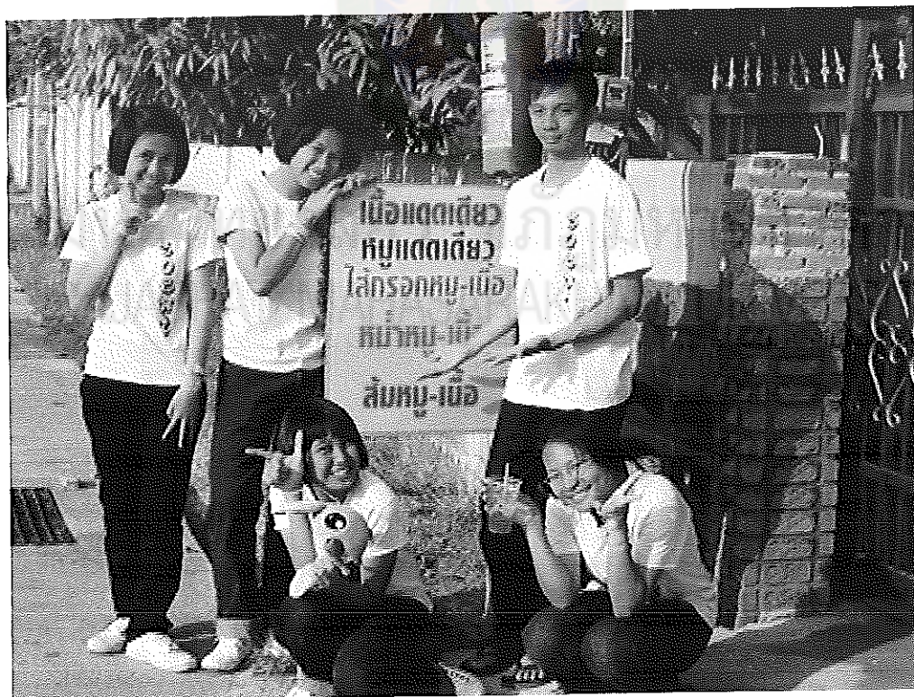
ภาพภาคผนวกที่ 2 แหล่งเรียนรู้