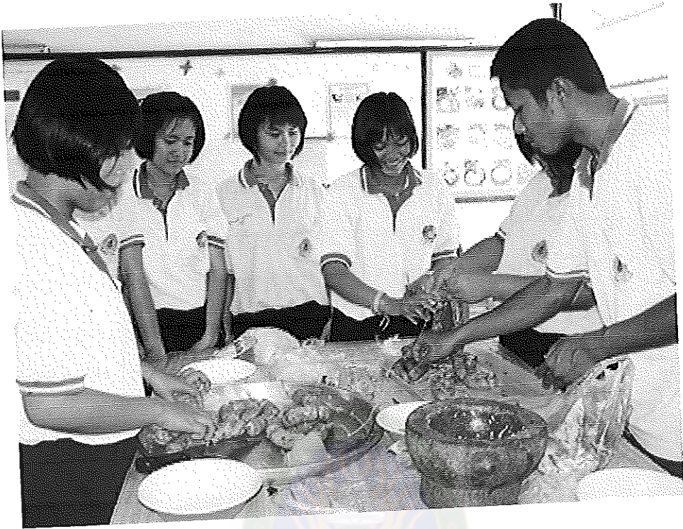
ภาพภาคผนวกที่ 9 ฝึกการทำไส้กรอก