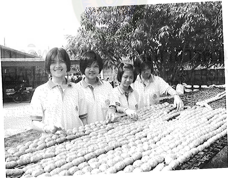
ภาพภาคผนวกที่ 10 ผลการปฏิบัติงาน