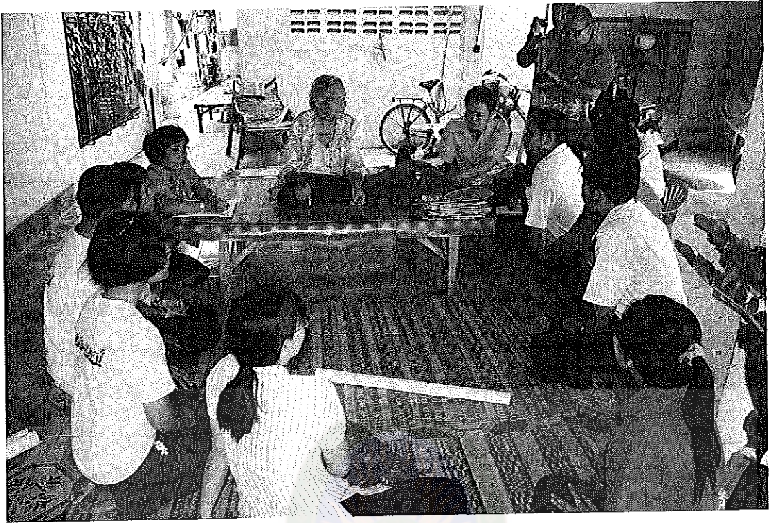
ภาพภาคผนวกที่ 4 ภูมิปัญญาเล่าประสบการณ์