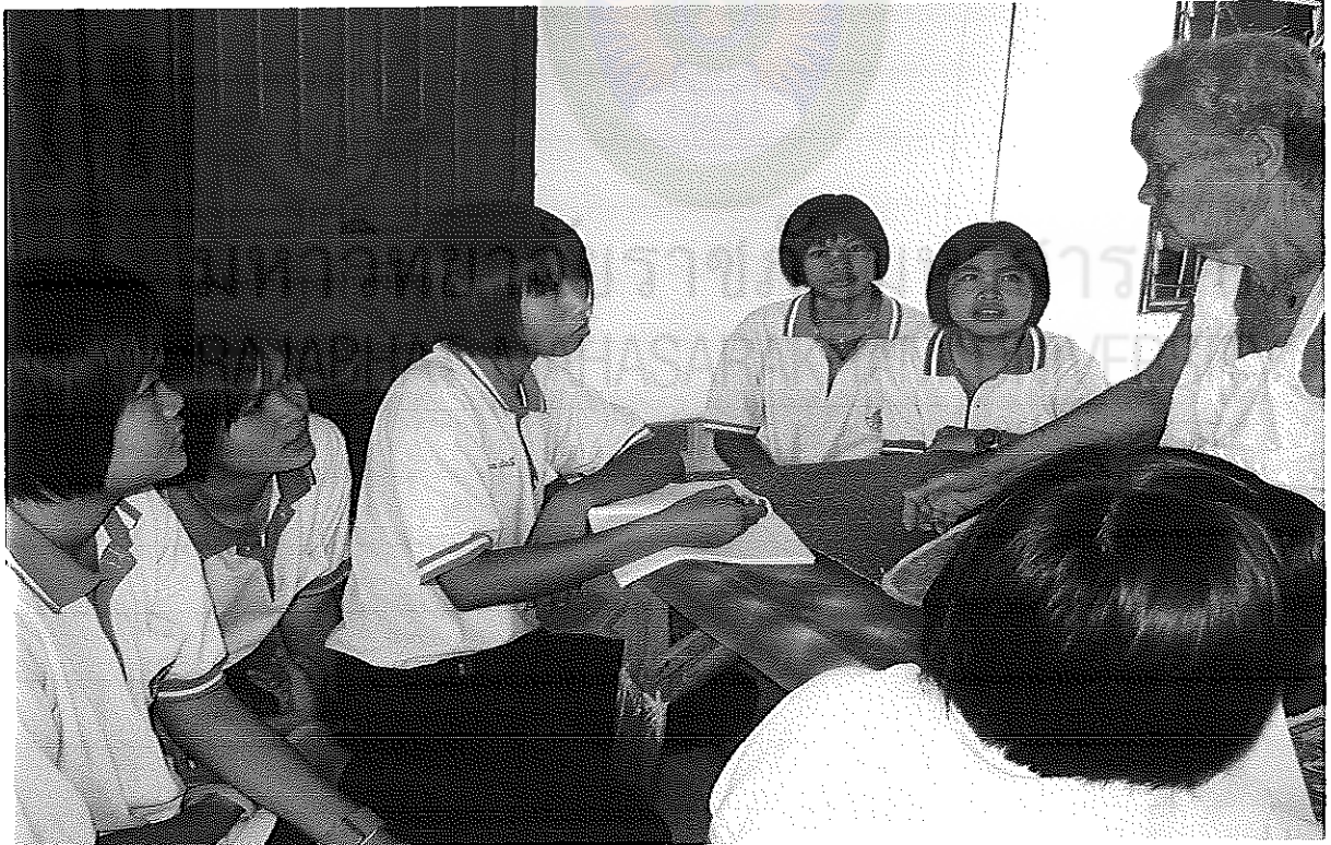
ภาพภาคผนวกที่ 6 นักเรียนฟังและจับประเด็น