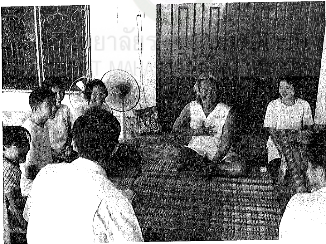
ภาพภาคผนวกที่ 3 การสนทนากลุ่ม