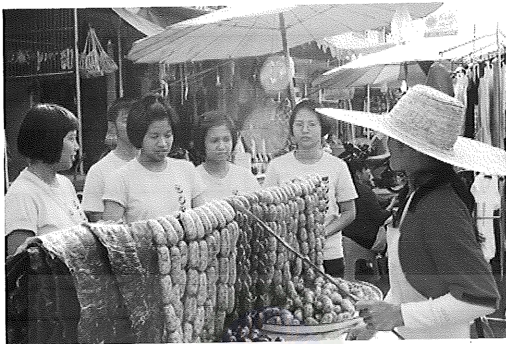
ภาพภาคผนวกที่ 1 การสัมภาษณ์ คันทาแหล่งเรียนรู้