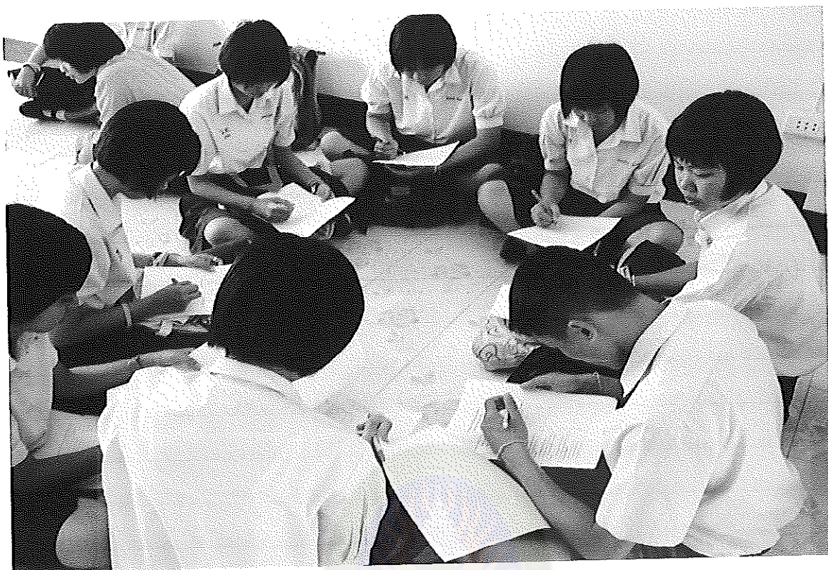
ภาพภาคผนวกที่ 7 การสกัดขุมความรู้