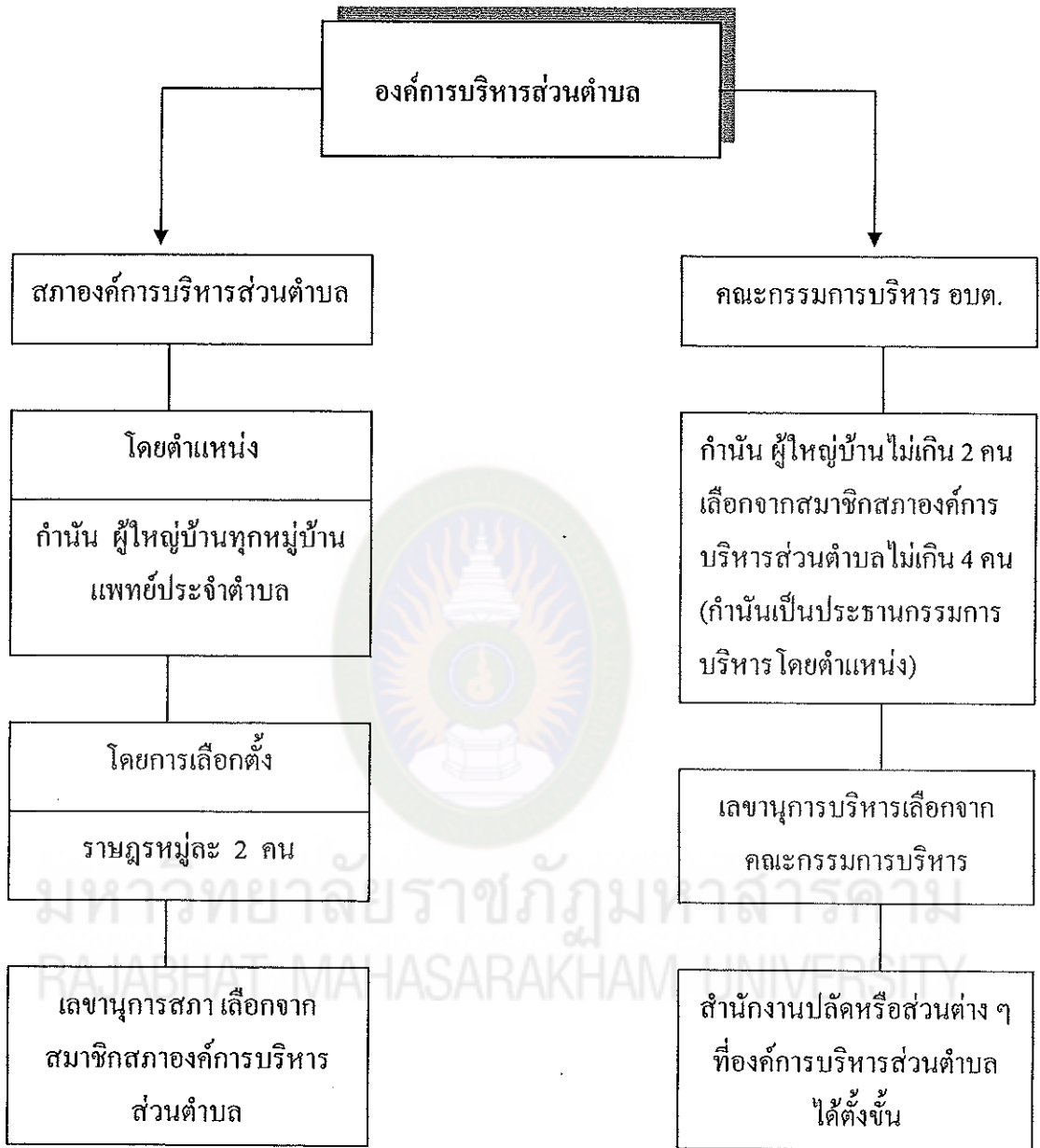
แผนภูมิที่ 1 โครงสร้างองค์การบริหารส่วนตำบล (โครงสร้างเดิม)