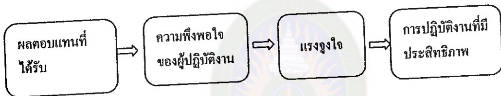
ภาพประกอบที่ 1 ความพึงพอใจนำไปสู่การปฏิบัติงานที่มีประสิทธิภาพ

แนวความคิดดังกล่าว ครูผู้สอนที่ต้องการพัฒนากิจกรรมการเรียนรู้ที่เน้นผู้เรียนเป็นศูนย์กลางบรรลุผลสำเร็จ จึงต้องคำนึงถึงการจัดบรรยากาศ และสถานการณ์ รวมทั้งถืออุปการณ์การเรียนการสอนที่เอื้ออำนวยต่อการเรียน เพื่อตอบสนองความพึงพอใจของผู้เรียนให้มีแรงจูงใจในการทำกิจกรรมจนบรรลุตามวัตถุประสงค์ของหลักสูตร