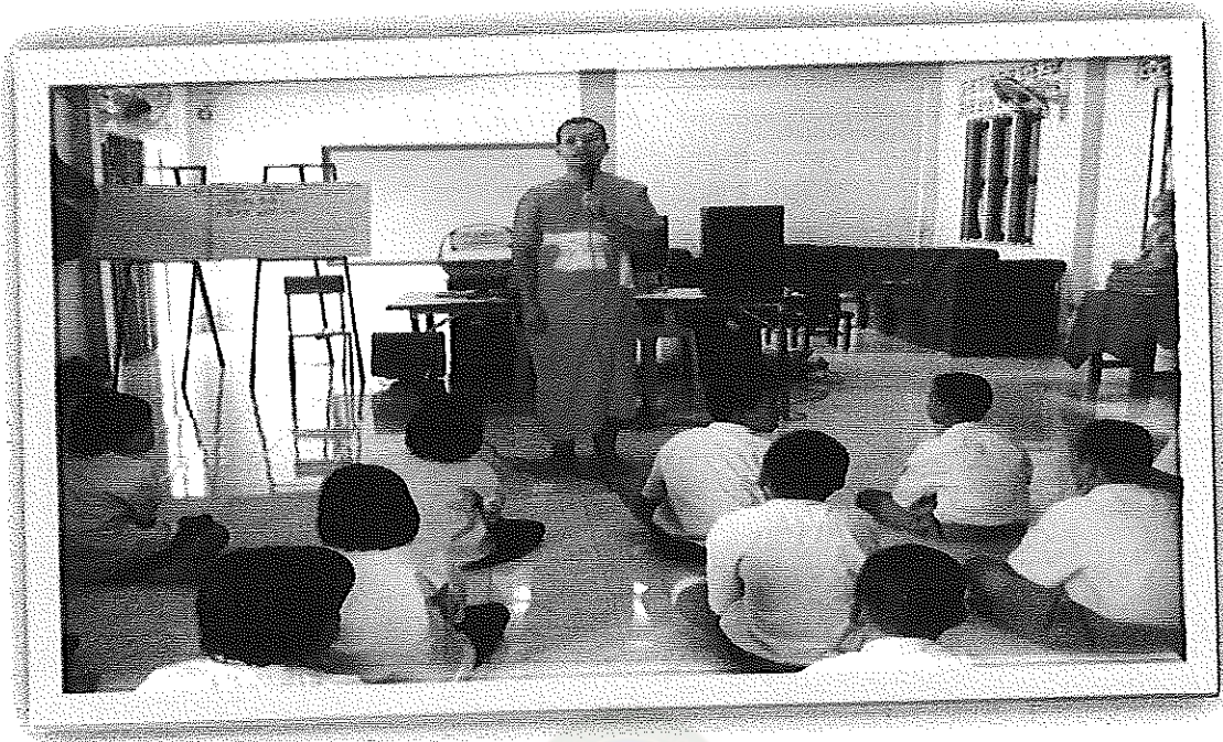
ภาพภาคผนวกที่ 5 กิจกรรมการอบรมวินัยนักเรียน