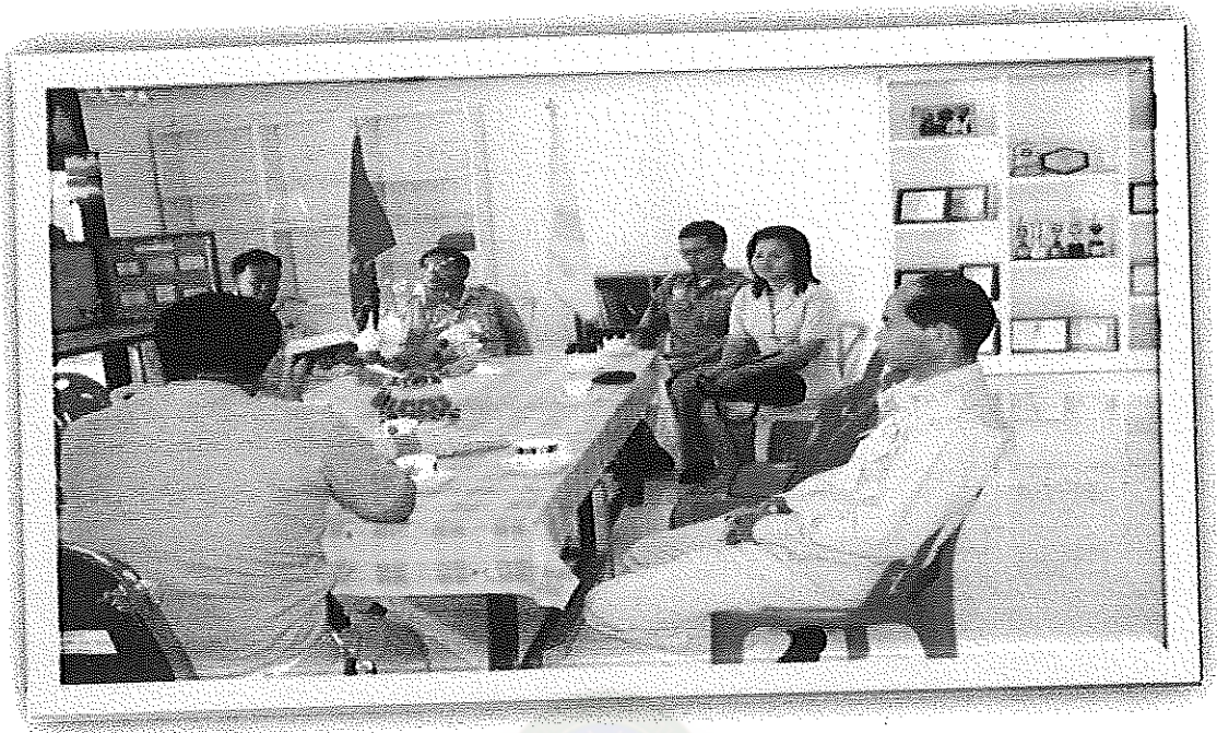
ภาพภาคผนวกที่ 1 กิจกรรมการประชุมครูในโรงเรียน