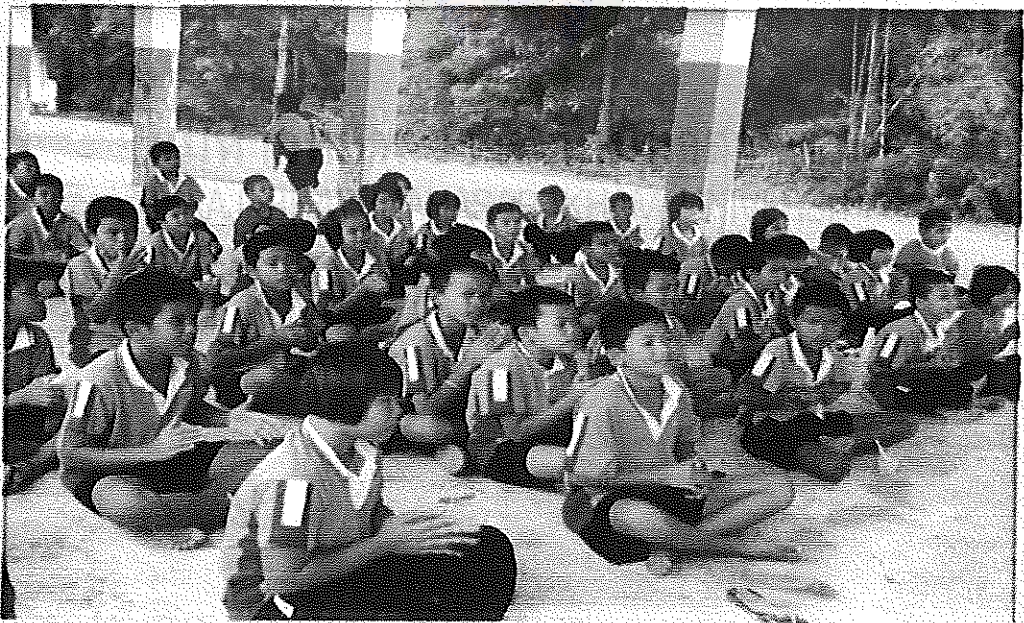
ภาพภาคผนวกที่ 12 กิจกรรมรณรงค์ปฏิบัติตามกฎระเบียบของโรงเรียน