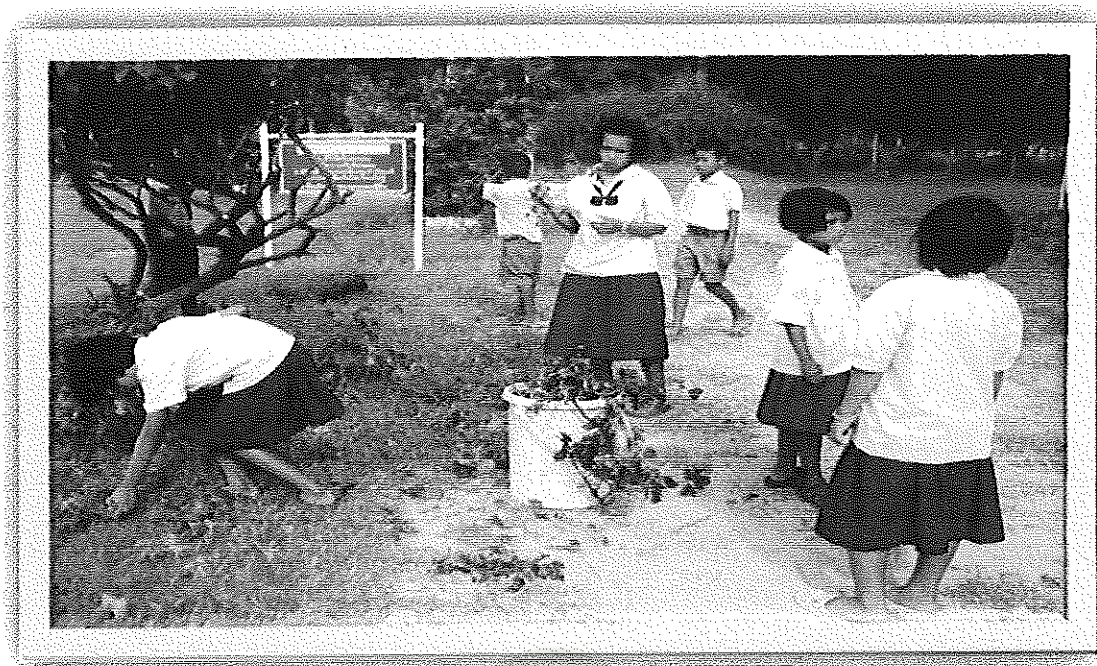
ภาพภาคผนวกที่ 9 กิจกรรม แบ่งโซนทำความสะอาด