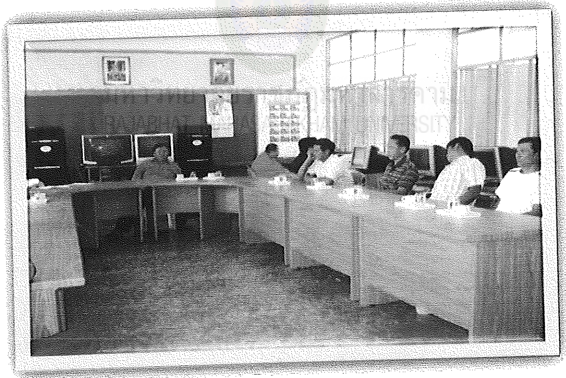
ภาพภาคผนวกที่ 2 กิจกรรมการประชุมคณะกรรมการสถานศึกษา