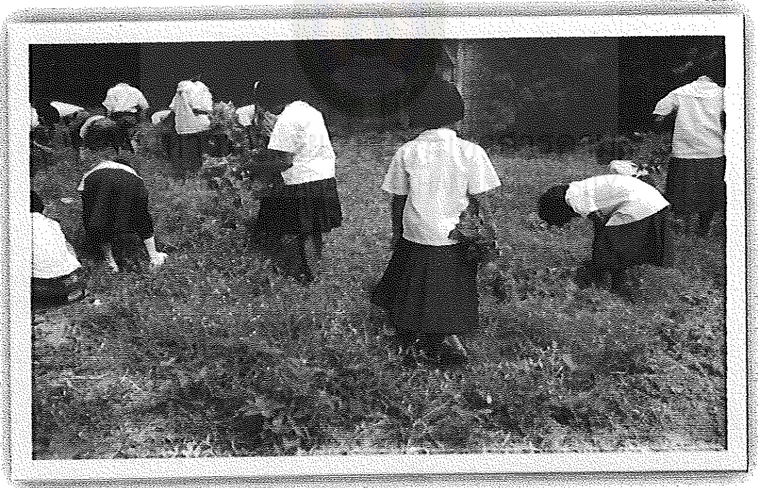
ภาพภาคผนวกที่ 8 กิจกรรมแบ่งเขตรับผิดชอบ