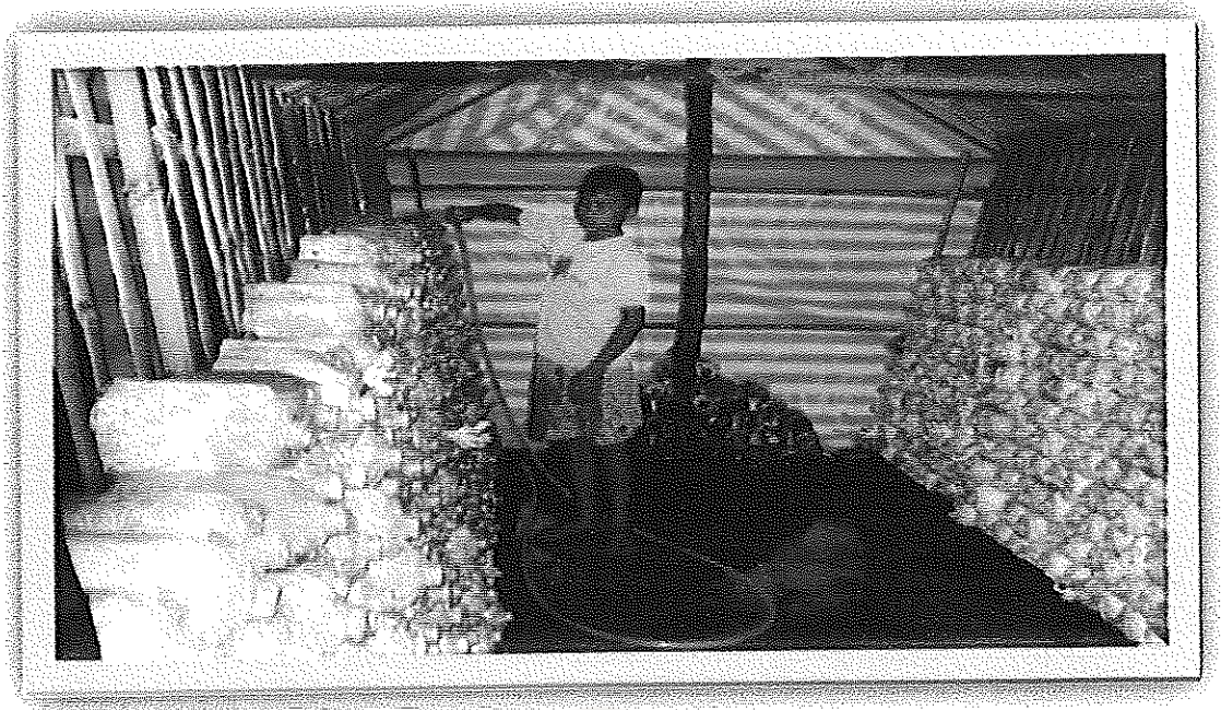
ภาพภาคผนวกที่ 7 กิจกรรมแบ่งเขตรับผิดชอบ