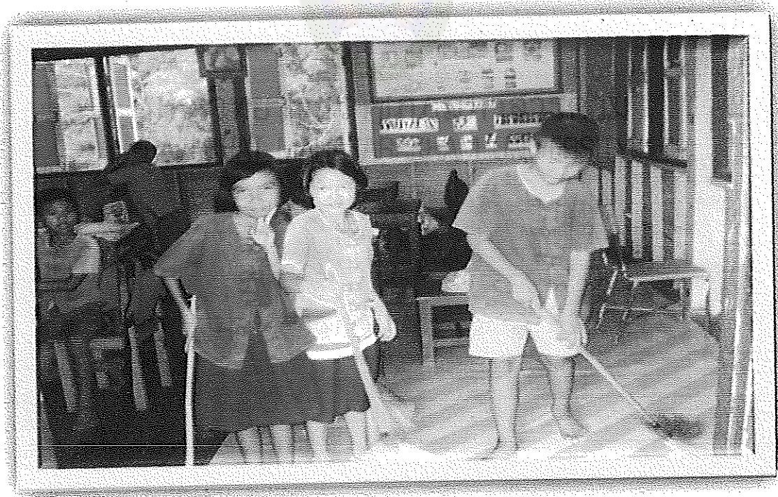
ภาพภาคผนวกที่ 4 กิจกรรมประกวดห้องเรียนสะอาด