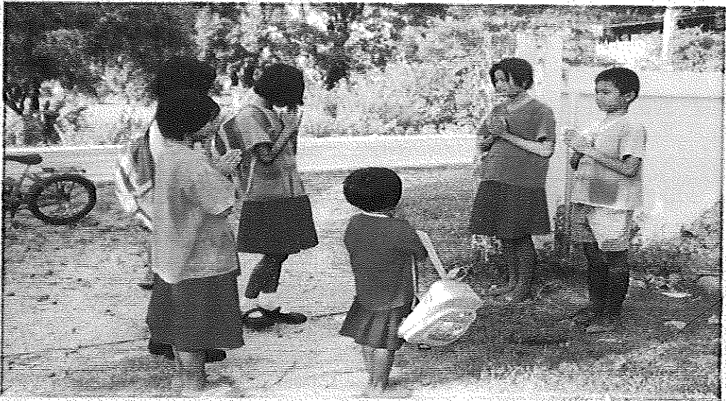
ภาพภาคผนวกที่ 11 กิจกรรมมาด้วยกันไปด้วยกันทันเวลา