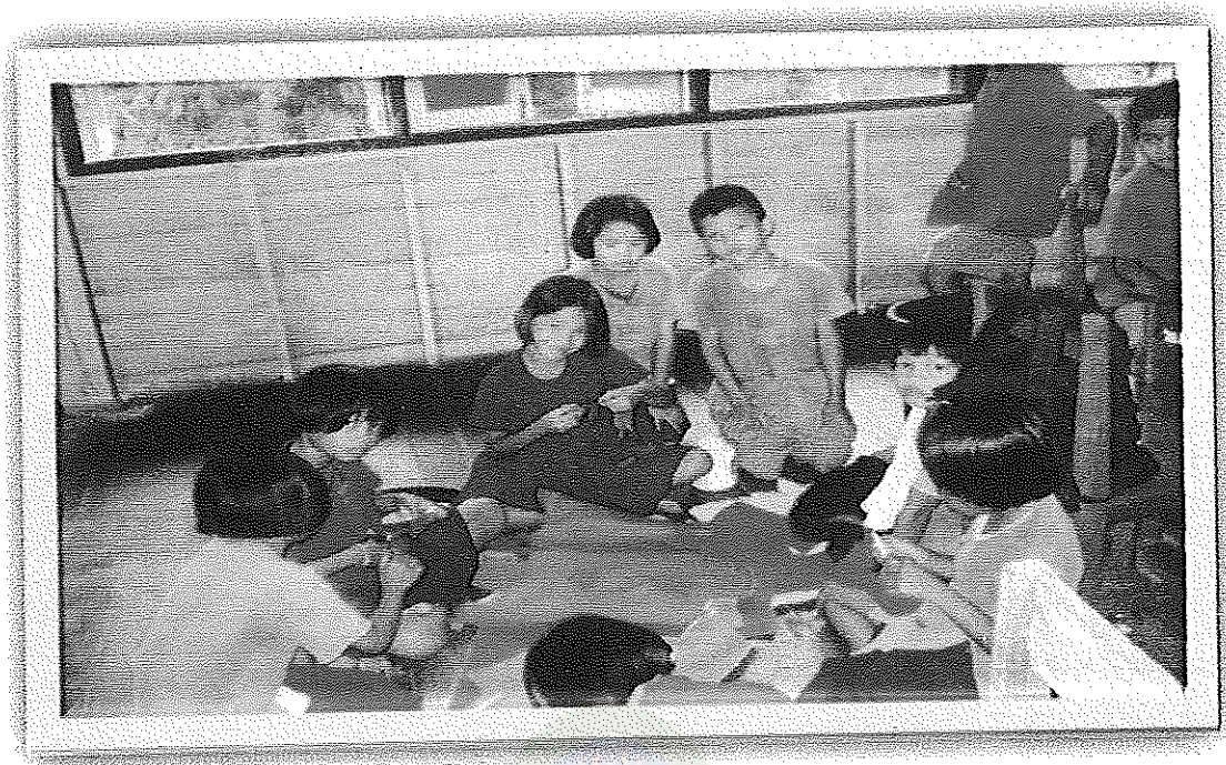
ภาพภาคผนวกที่ 3 กิจกรรมประกวดห้องเรียนสะอาด