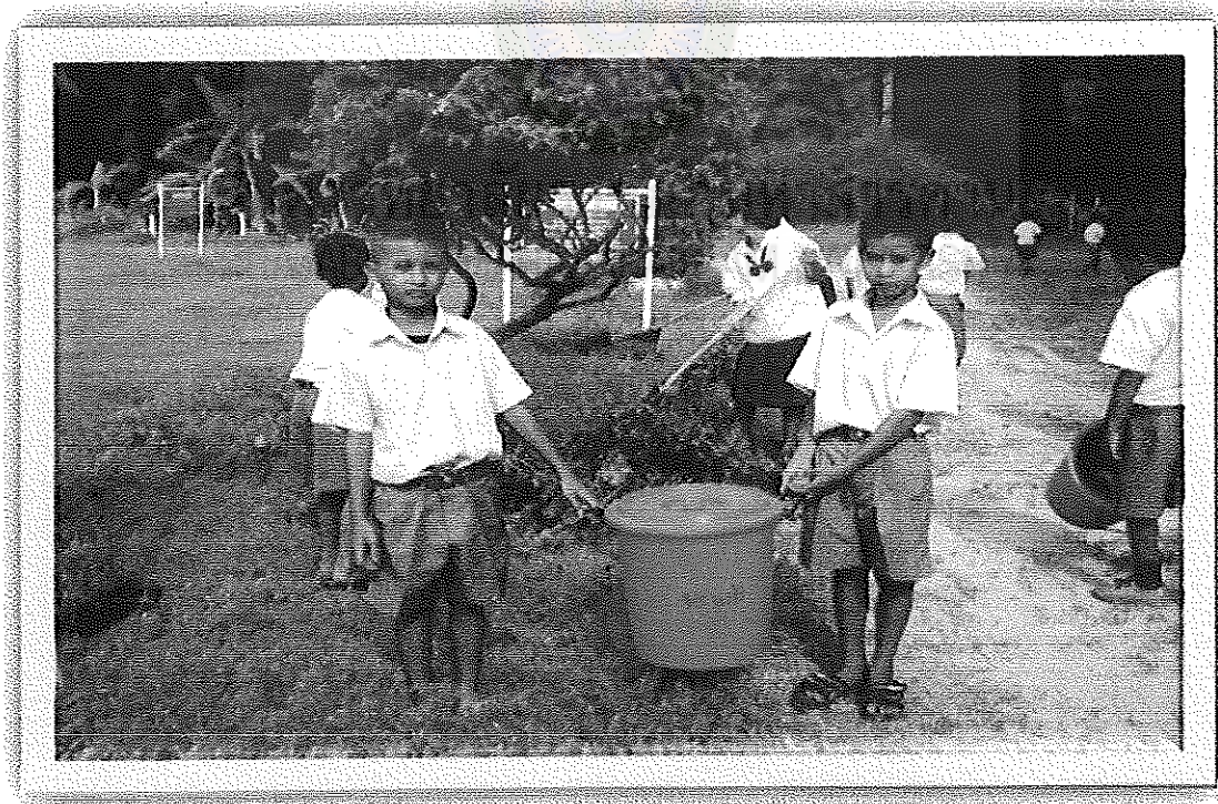
ภาพภาคผนวกที่ 10 กิจกรรมโรงเรียนสะอาดด้วยมือเรา