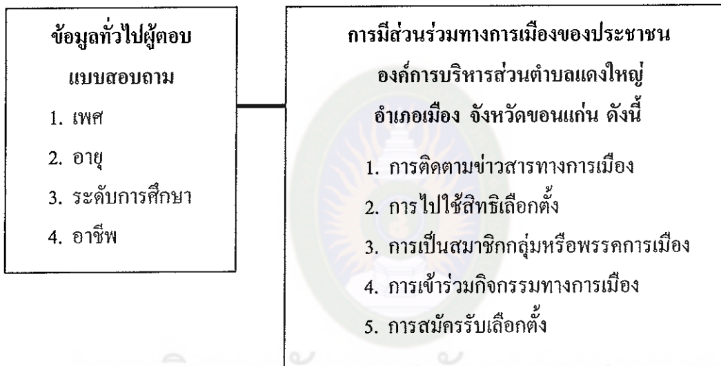
แผนภูมิที่ 1 กรอบแนวคิดการศึกษา

จากการศึกษาทฤษฎี แนวคิด และงานวิจัยที่เกี่ยวข้อง ผู้ศึกษาได้นำแนวคิดเกี่ยวกับการมีส่วนร่วมทางการเมืองของ เวอร์บา ไนท์ และคีนร์ ซึ่งได้กล่าวถึงรูปแบบการมีส่วนร่วมทางการเมืองไว้ 4 รูปแบบ และ ฮันติงตันและเนลสัน ซึ่งได้กล่าวถึงรูปแบบการมีส่วนร่วมทางการเมืองไว้ 5 รูปแบบ (สิทธิพันธ์ พุทธทูน. 2541 : 158-159) มาปรับประยุกต์เพื่อใช้เป็นกรอบในการศึกษาร่วมทางการเมืองของประชาชนตำบลแดงใหญ่ อำเภอเมือง จังหวัดขอนแก่น ดังแผนภูมิที่ 1