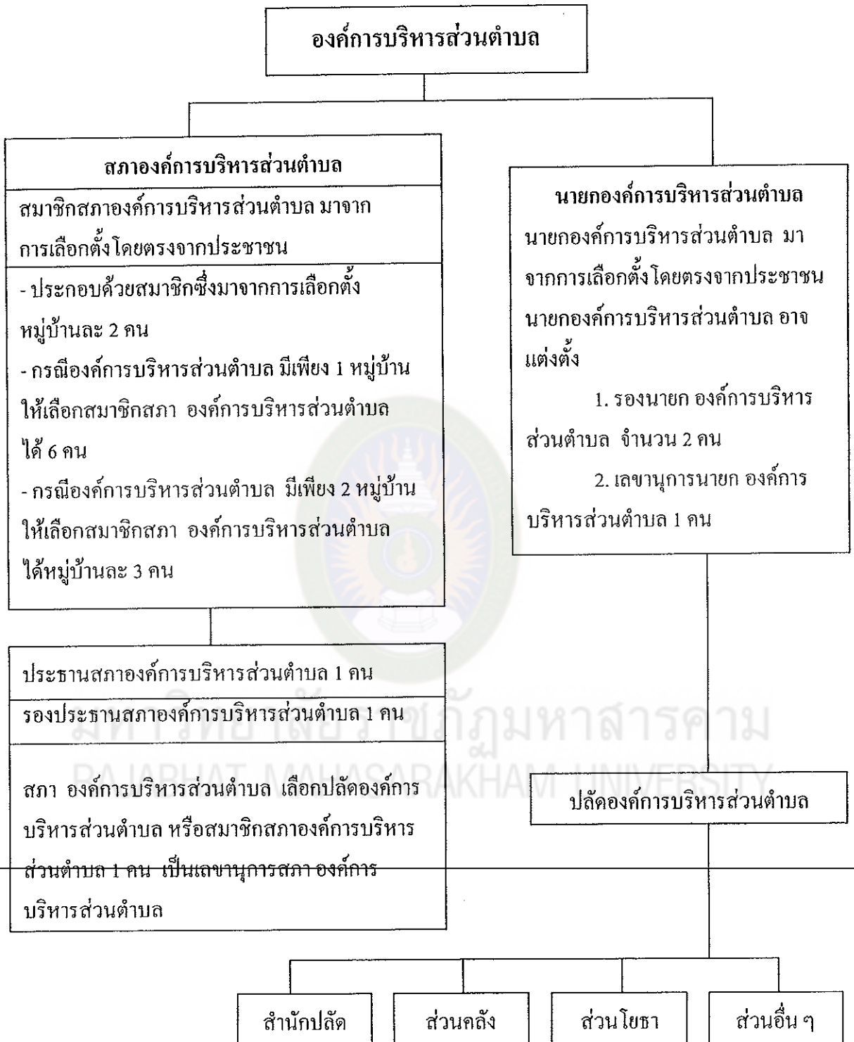
แผนภาพที่ 2 โครงสร้างองค์การบริหารส่วนตำบล