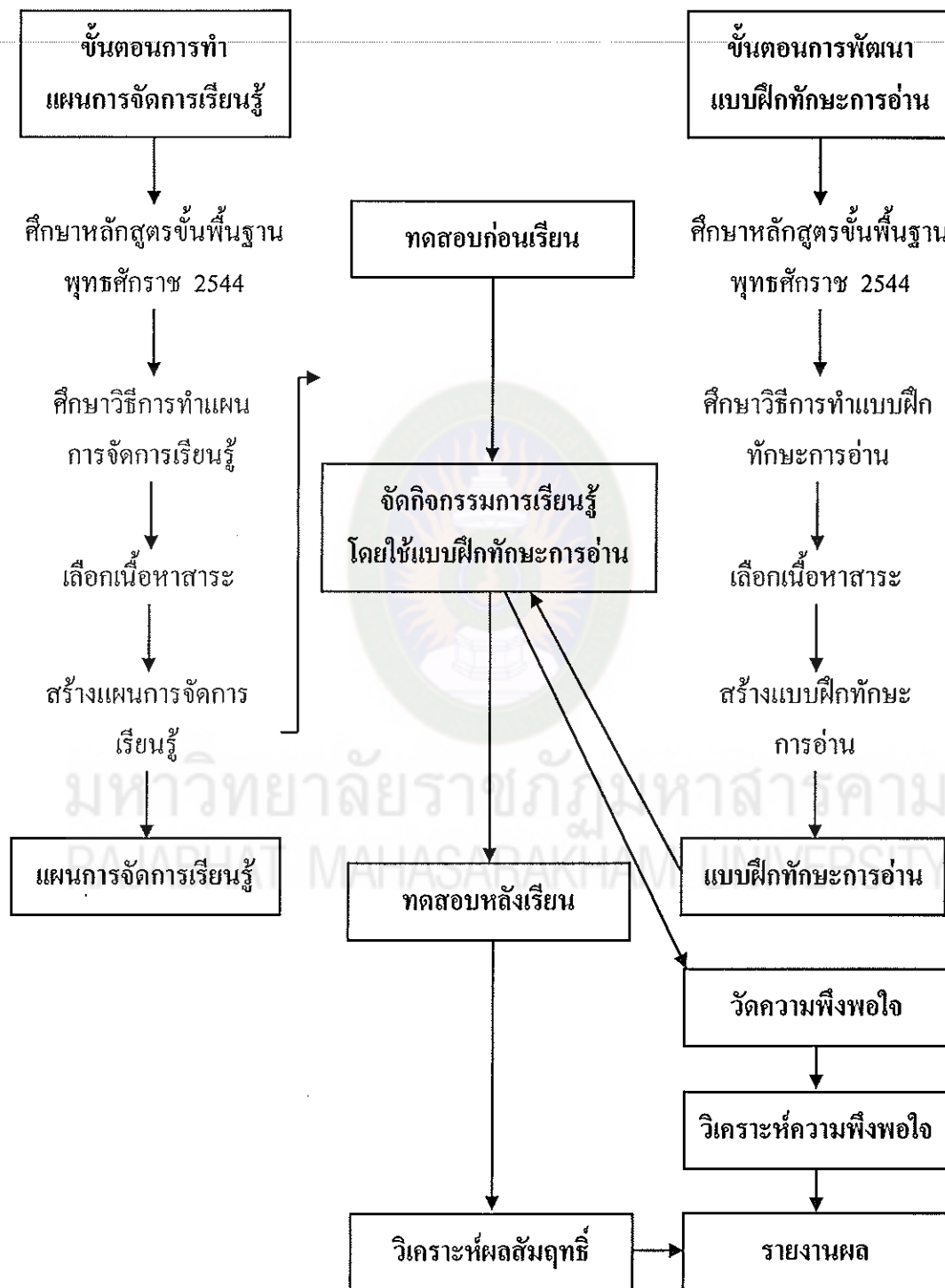
แผนภูมิที่ 1 กรอบแนวคิดในการวิจัย