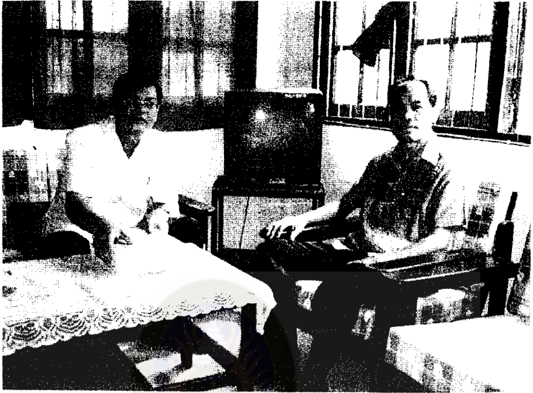
สัมภาษณ์การเตรียมการสอน และการประเมินผล