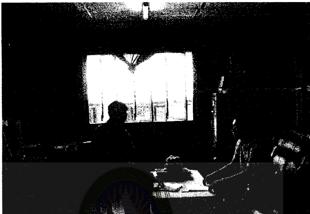
สัมภาษณ์การดำเนินการจัดกิจกรรมการเรียนการสอน