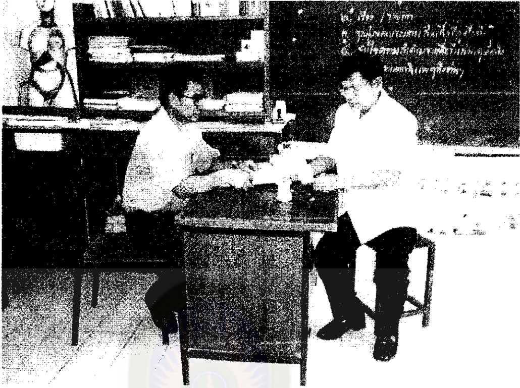
สัมภาษณ์การดำเนินงานการจัดกิจกรรมการเรียนการสอนที่เน้นผู้เรียนเป็นสำคัญ