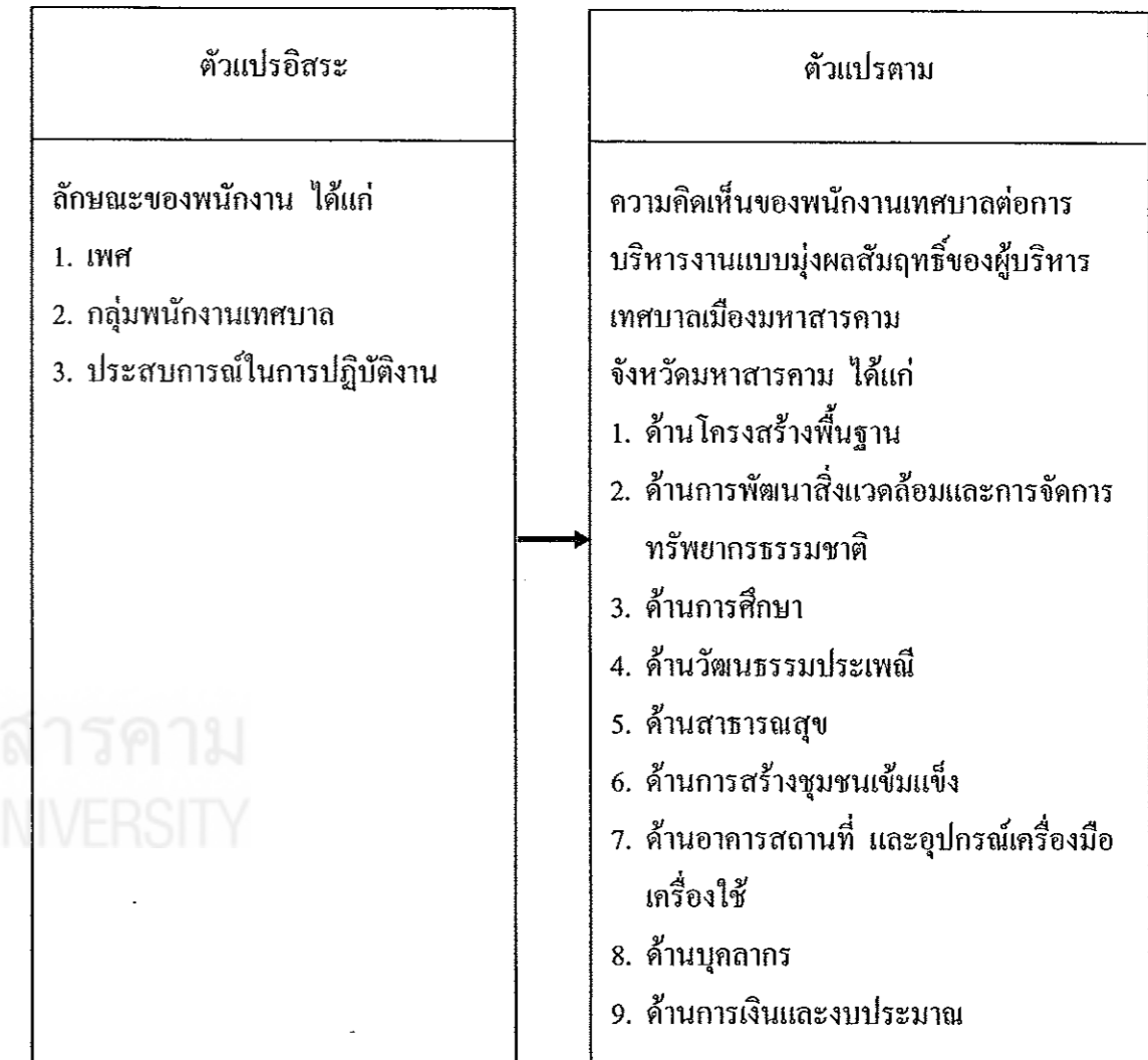
แผนภูมิที่ 3 กรอบแนวคิดในการวิจัย

โดยแสดงความสัมพันธ์ของตัวแปรอิสระและตัวแปรตามได้ดังแผนภูมิที่ 3